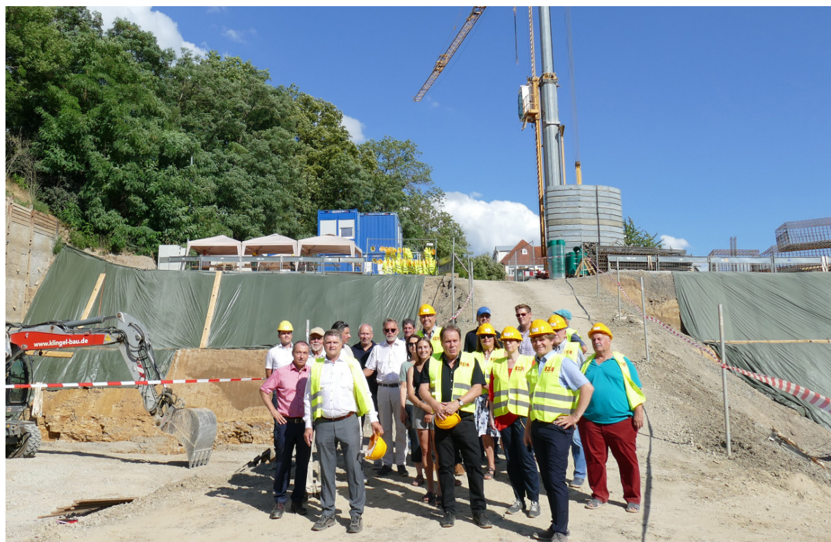
Vor der Sitzung des Gemeinderats informierten sich die Mitglieder des Gremiums über die Fortschritte beim Bau der Tiefgarage Sporgasse.

Auf der Sitzung des Gemeinderats am Dienstag beschloss das Gremium einstimmig die Widmung des "Gut Schwarzerdhof" als besonderer Trauort der Stadt Bretten. In Zu-