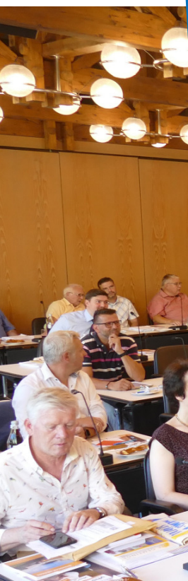
Auf der konstituierenden Sitzung des neuen Gemeinderates wurden zahlreiche ehrenamtliche Kommunalpolitiker geehrt, die sich den Zuschauerbereich mit interessierten Bürgern teilten.