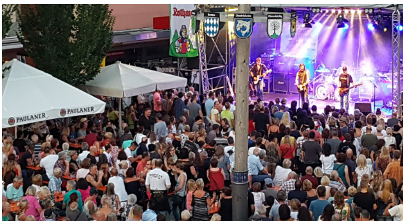
Mittlerweile zum 22. Mal findet Bretten live! auf dem Marktplatz statt und begeistert wie hier auf dem Foto von 2018 zu sehen mehrere Tausend Menschen am gesamten Wochenende.