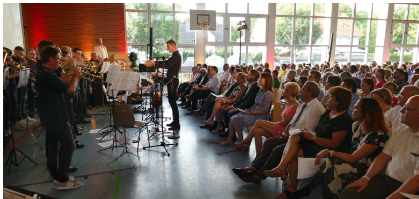
Der Posaunenchor Rinklingen eröffnete den Festakt am Freitag in der Sporthalle.