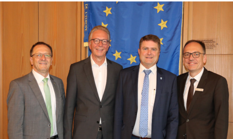
Ulrich: Thomas Nowitzki (Bürgermeister Oberderdingen), Roger Kehle (Präsident des Gemeindetags Baden-Württemberg), Martin Wolff (Oberbürgermeister Bretten) und Knut Bühler (Erster Landesbeamter)

Am vergangenen Mittwoch trafen sich die Landkreisbürgermeisterinnen und Bürgermeister der 32 Städte und Gemeinden zur jüngsten Kreisversammlung im Sitzungssaal des Brettener Rathauses. Es fand ein reger Austausch zu den unterschiedlichen Themen der Tagesordnung statt. Den Auftakt bildete ein Bericht zum Breitbandausbau. Dank einer Kofinanzierung durch Landes- und Bundesmittel ist zukünftig eine Förderung von 90 % möglich. Aktuell wurden bereits 2.568 private und gewerbliche Anschlüsse vorgenommen; weitere 1.836 sind bereits beauftragt – mit steigender Tendenz. Weiteres Thema war ein Sachstand über die Asylbewerberzahlen. Diese haben sich