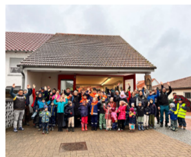
Die Teilnehmerinnen und Teilnehmer der Dorfputzete.

Mobiler Bürgerkoffer Am vergangenen Samstag, 14. März, fand die diesjährige Dorfputzete in Rinklingen statt. Über 50 Helferinnen und Helfer waren im Einsatz und haben den ganzen Vormittag über einen ganzen Container voll Müll eingesammelt. Die Ortsverwaltung bedankt sich herzlich für diesen großen ehrenamtlichen Einsatz.