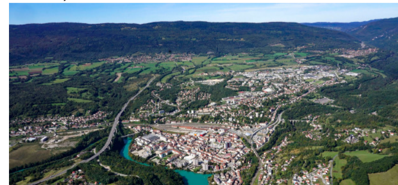
Luftbild von Valserhône

Alle Interessierten sind herzlich zur Vernissage eingeladen, bei der Bretten und Bellegarde zugleich auf 25 Jahre Städtepartnerschaft zurückblicken. Bis zum 24. April ist die Ausstellung zu den Öffnungszeiten des Rathauses zu sehen. (red)