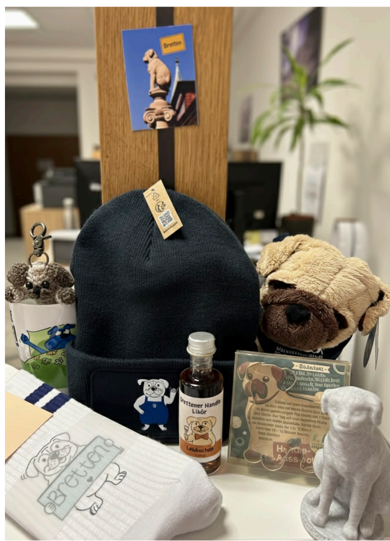
Das Brettener Hundle, Sympathieträger und Maskottchen, findet sich in vielen Gegenständen wieder, die es in der Tourist-Info zu kaufen gibt.

Ganz neu im Angebot ist der Brettener Honig als ein regionales Naturprodukt, das die Verbunden-