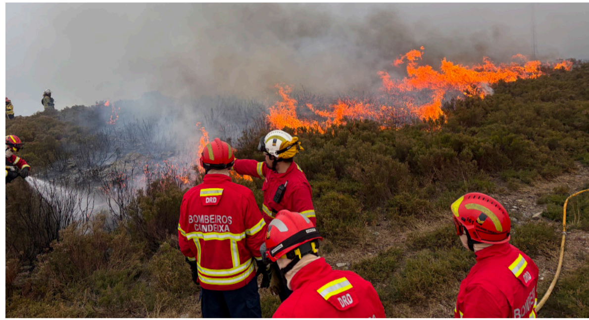
Feuerwehrübung in Condeixa

Intensive Ausbildung, wertvoller Austausch und gelebte Freundschaft