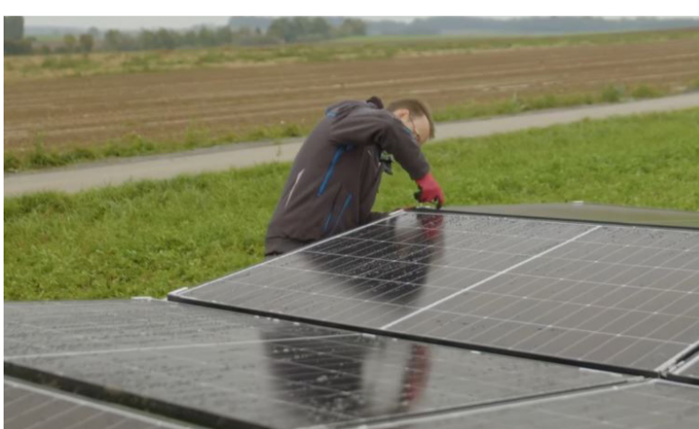
Montage von PV-Panels beim Bürger.Solarpark Eppingen.

Durch Haus- oder Wohnungsbesitzer oder Firmen können Dachflächen für die umweltfreundliche Stromerzeugung mit Photovoltaik genutzt werden. Mieter haben mit Balkon-PV-Anlagen die Möglichkeit, etwas für Klimaschutz und Kosteneinsparung zu tun. Wie das