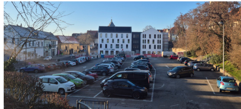
Für den bisherigen Parkplatz auf der Sporgasse werden Ideen gesucht.

Parallel dazu werden auch Schülerinnen und Schüler der weiterführenden Schulen in Bretten aktiv in den Beteiligungsprozess einbezogen. In verschiedenen Klassenstufen können sie ihre Ideen zur Entwicklung des Parkplatzes an der Sporgasse „Sporgasse II“ kreativ in Form von Plakaten darstellen und ebenfalls an der Onlinebefragung teilnehmen. Auf diese Weise erhalten auch die Perspektiven junger