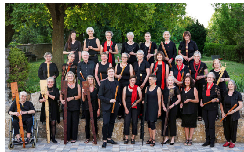
Das Blockflötenensemble Picobella aus Dürrenbüchig tritt am 26. März im Melanchthonhaus auf. Der Eintritt ist frei.

Zu einem Konzert des Blockflötenensembles Picobella laden wir alle Musikinteressierten am Donnerstag, 26. März, 19.30 Uhr, herzlich ins Melanchthonhaus Bretten ein. Das Konzert trägt den Titel „Im Lustgarten der Klänge. Leidenschaftliche und fröhliche Musik von der Renaissance bis in die Neuzeit“. Das Dürrenbüchiger Blockflötenorchester Picobella präsentiert leidenschaftliche und fröhliche Musik rund um die beliebte Sammlung „Lustgarten deutscher Gesäng,