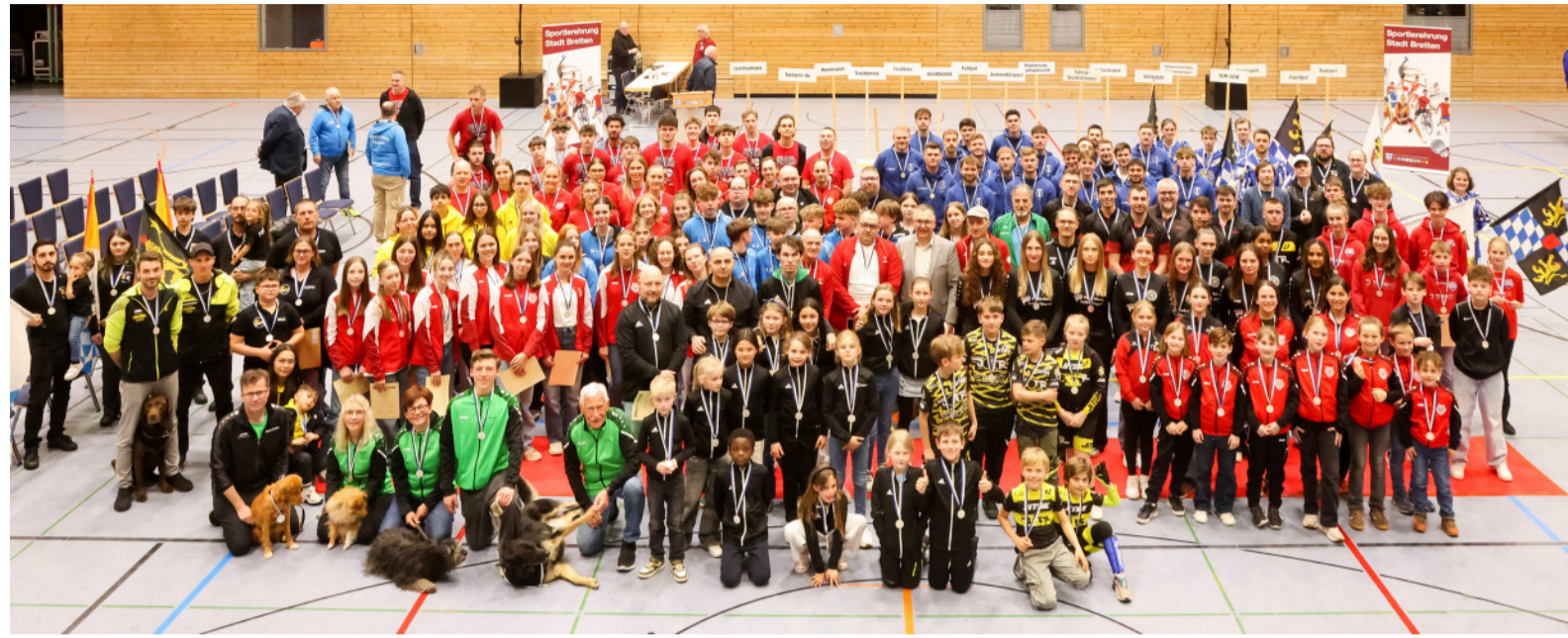
Gruppenbild mit allen Geehrten bei der Sportlerehrung für das Jahr 2025 am vergangenen Freitag im Hallensportzentrum.