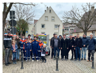
Die Teilnehmerinnen und Teilnehmer der Dorfputzete.

Der Ortschaftsrat bedankt sich herzlich bei allen, die eine Patenschaft übernommen haben und damit zu einem saubereren Ortsbild beitragen.