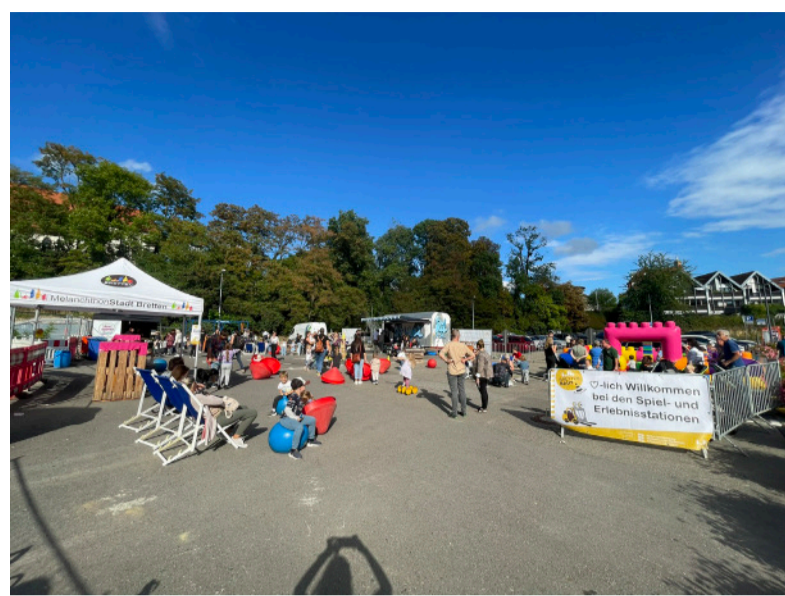
Aktuell dient der östliche Teil des Sporgassenareals zum Parken, ersatzweise für den Markt, oder wie hier im Bild für Events wie die Kinderbaustelle im September.

Kreative Beiträge wie Plakate, Collagen oder Modelle werden gesammelt, begleitet von einem