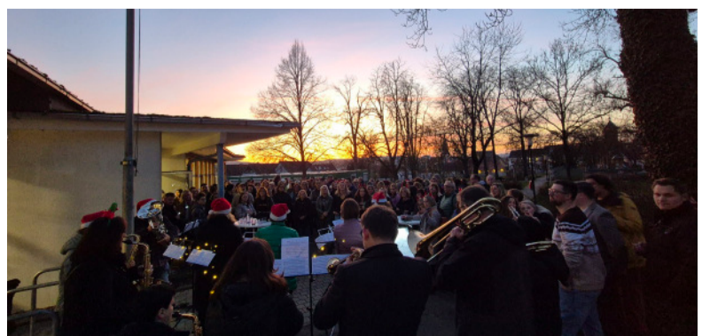
Weihnachtliches Ambiente vor der Stadtparkhalle.