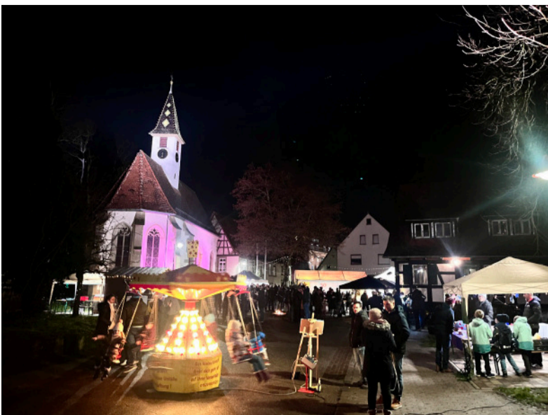
In stimmungsvollem Ambiente lud der Sprantaler Weihnachtsmarkt zum Verweilen und Genießen ein.

Der Weihnachtsmarkt in Sprantal, organisiert vom Ortschaftsrat, war ein voller Erfolg. Bei stimmungsvoller Beleuchtung und festlicher Atmosphäre kamen zahlreiche Besucher zusammen, um die Vorweihnachtszeit gemeinsam zu genießen. Für das leibliche Wohl sorgten die Feuerwehr, das DRK, der SC Sprantal und die Landfrauen mit verschiedenen Speisen und Getränken. Der Weinkampf bot erlesene Weine an, während die Dorfprinzwerkstatt liebevoll gestaltete Sprantal-Artikel präsentierte. Selbstgemachtes vom Verein Lichtblick ergänzte das vielfältige Angebot.