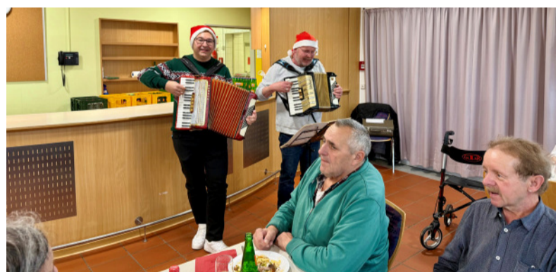
Schöne Stunden bei gutem Essen und guter Musik.