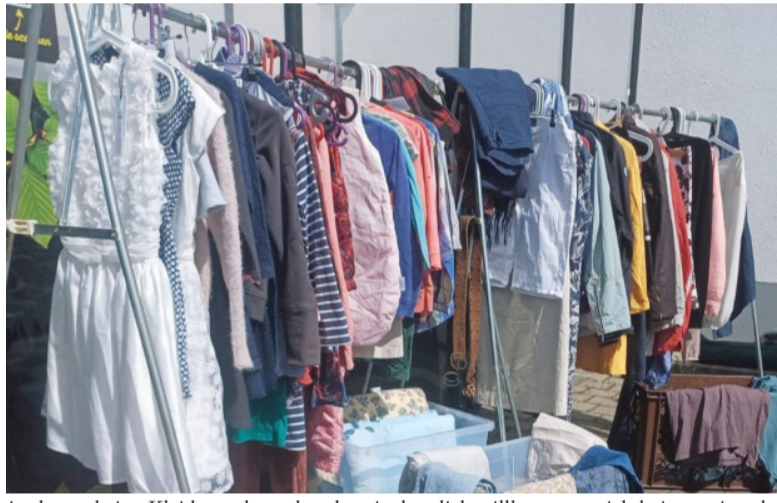
Auch wer keine Kleidung abzugeben hat, ist herzlich willkommen, sich bei uns ein oder mehrere „neue“ Lieblingsstücke auszusuchen.

Kaufen – Tragen – Wegschmeißen. Immer mehr, immer schneller, immer billiger. So funktioniert das System „Fast Fashion“. Doch was hat meine Fleece-Jacke mit Mikroplastik, mein Kleid mit dem Klimawandel und meine Jeans mit den Arbeits- und Lebensbedingungen für die Näher:innen zu tun? Leider ziemlich viel. Denn jedes Kleidungsstück ist mit Problemen für die Umwelt und die Menschen vor allem im Globalen Süden verbunden, da es viele Ressourcen und Arbeit braucht, um es herzustellen, aber auch zu entsorgen. Wussten Sie, dass zur Herstellung eines T-Shirts 2.700 l Wasser verbraucht und 11 kg CO2 freigesetzt werden? Für eine Jeans werden 8.000 l Wasser benötigt! 60 neue Kleidungsstücke finden jedes Jahr