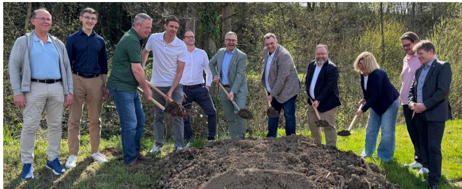
Mit dem symbolischen Spatenstich gaben Vertreter aus Politik, Verwaltung und Planung den Startschuss für den weiteren Ausbau des Hochwasserschutzes an der Weißach.