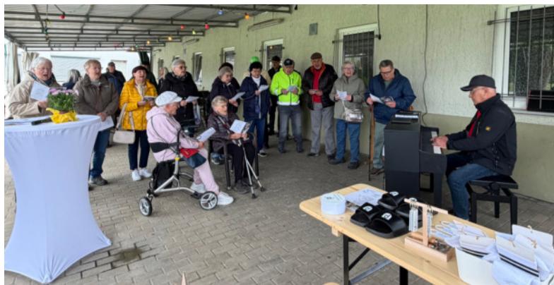
Musikalische Begleitung der Singgruppe des Gesangsvereins Gölshausen