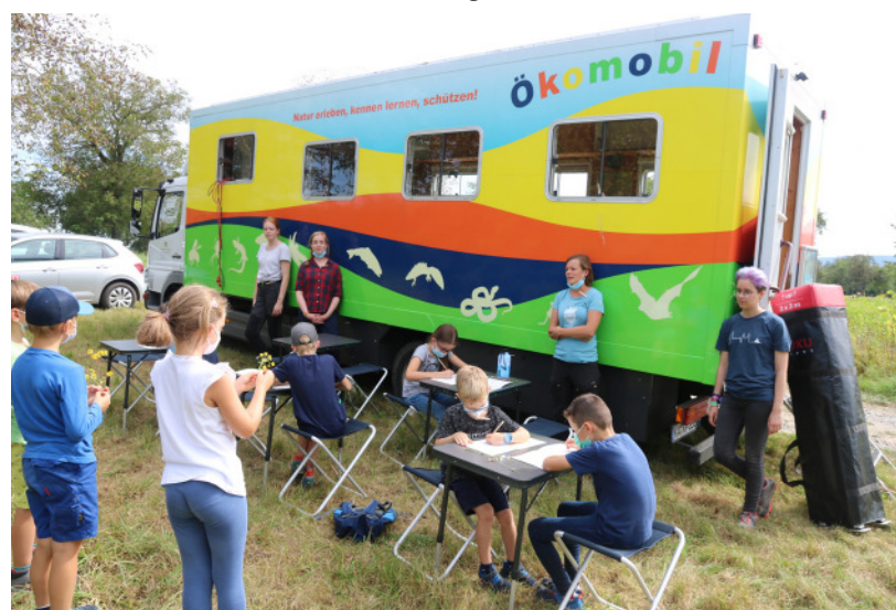
Natur erleben, kennenlernen und schützen. Diesem Motto folgen die Kinder der Naturschutzjugend (NAJU) gemeinsam mit dem Ökomobil.

Das Ökomobil kann jeder einladen, egal ob Kinder, Jugendliche oder Erwachsene. Auch Ferienprogramme oder Naturerlebnistage werden unterstützt. Unter www.oekomobile-bw.de ist der Anmeldebogen zu finden. Im Moment ist das Ökomobil auf 12 Teilnehmer begrenzt und man rechnet mit eineinhalb Stunden Veranstaltungsdauer. Der Einsatz des Ökomobils wird vom Land Baden-Württemberg gefördert und ist daher kostenlos.