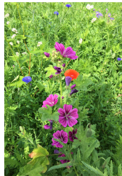
Auch bei der Saarstraße (links) und dem Roton-Gelände (rechts) wurde eine Veithöchsheimer Bienenweide gesät.