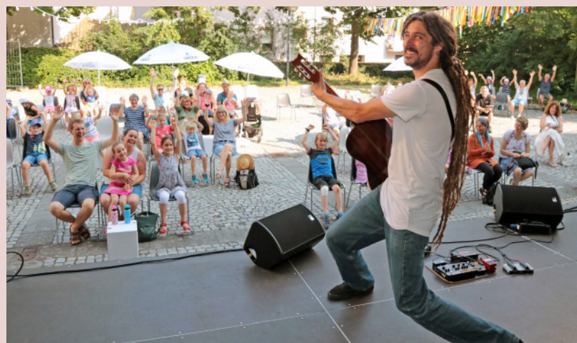
In diesem Jahr wurde das Programm um Angebote für Kinder und Familien erweitert: neben einem Kinderkonzert mit el mago masin als Toni Komisch wurden auch zwei Puppentheatervorstellungen angeboten.

Programm routiniert organisieren und in stimmungsvoller Atmosphäre präsentieren. Der KulturFreitag hat sich schnell zum kulturellen Geheimtipp in der Region entwickelt und mittlerweile etabliert. Das vielseitige Programm mit regionalen und überregional bekannten Künstlern fand dabei weit über die Stadtgrenzen hinaus ein interessiertes und begeistertes Publikum.