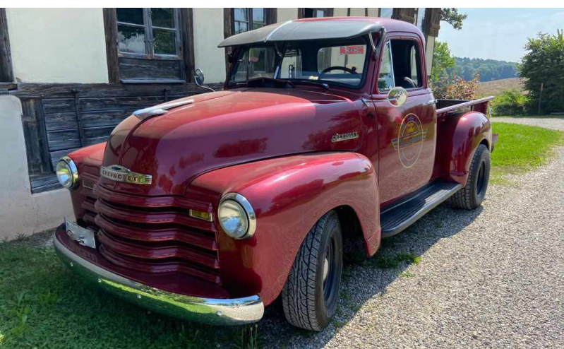
Auch Oldtimerfans kommen auf ihre Kosten: Im gesamten Innenstadtbereich können am Sonntag bei gutem Wetter liebevoll restaurierte oder hervorragend erhaltene Oldtimer bewundert werden.