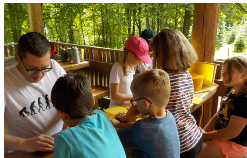
Die Kinder beim Basteln von Bienenwachskerzen.

Vergangenen Sonntag am 12.09.2021 fand der diesjährige Naturerlebnistag der Stadt Bretten in der Saatschule im Großen Wald statt. Anders als in den vergangenen Jahren konnte der Naturerlebnistag nur in einem kleinen Rahmen abgehalten werden. In dem Zeitraum von 12:00 bis 17:00 Uhr konnten die insgesamt 16 Kinder durch drei verschiedene Stationen vieles rund um die Natur lernen. Beim Geocaching mit Triple-L gingen die Kinder auf Schatzsuche und lösten dabei mehrere Rätsel. Zusammen mit dem Imkerverein tauchten die