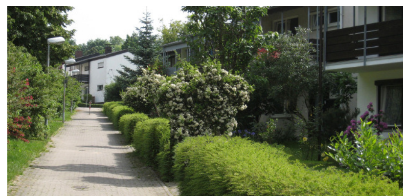
Innerhalb des Vortrags am Mittwoch, 29. September stellt Ihnen Frieder Weigand attraktive und gleichzeitig pflegeleichte Alternativen zum Schottergarten vor.