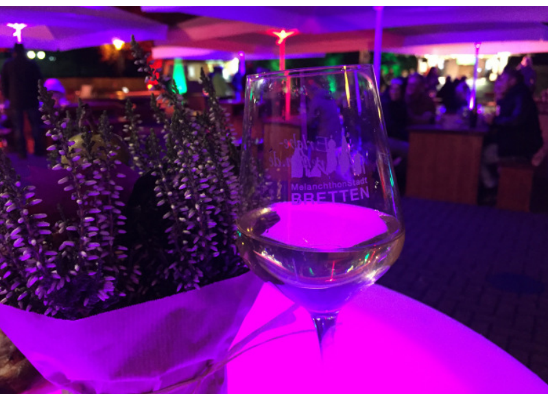
Auf dem Seedamm präsentieren Weingüter und Winzer der Region ihre edlen Tropfen und laden zur Verkostung ein.

„Kunst und Genuss“ lädt am Wochenende vom 24. bis 26. September mit einem Mix aus Kunst, Genuss und Musik zum Genießen und Entdecken in die Brettener Innenstadt ein. Zahlreiche Weingüter und Winzer der Region, präsentieren am Seedamm ein vielfältiges Weinangebot. Gemütliche Sitzcken und ein kleines kulinarisches Angebot sorgen für entspannte Stunden unter freiem Himmel. Für den Einlass in den Weinbereich werden die 3-G-Regelung und die Kontaktnachverfolgung durch die Luca App angewendet. Längere Öffnungszeiten des Einzelhandels am Samstag, der verkaufsoffene Sonntag mit Kunsthandwerkermarkt und Oldtimerausstellung, dazu Musik- und Kunst von rund 15 Künstlern unterhalten die Besucher an diesem Wochenende. Für die kleinen Gäste gibt es ein kreatives Angebot sowie ein Kinderkarussell welches auf dem Volksbankparkplatz in der Fußgängerzone am Samstag und am Sonntag seine Runden dreht. Durch die Verteilung der Stände und die Aufteilung der verschiedenen Bereiche, ergibt sich ein weitläufiger Rundlauf mit zahlreichen Aktionen bei dem Jung und Alt zu einem unterhaltsamen Besuch in die Innenstadt eingeladen werden.