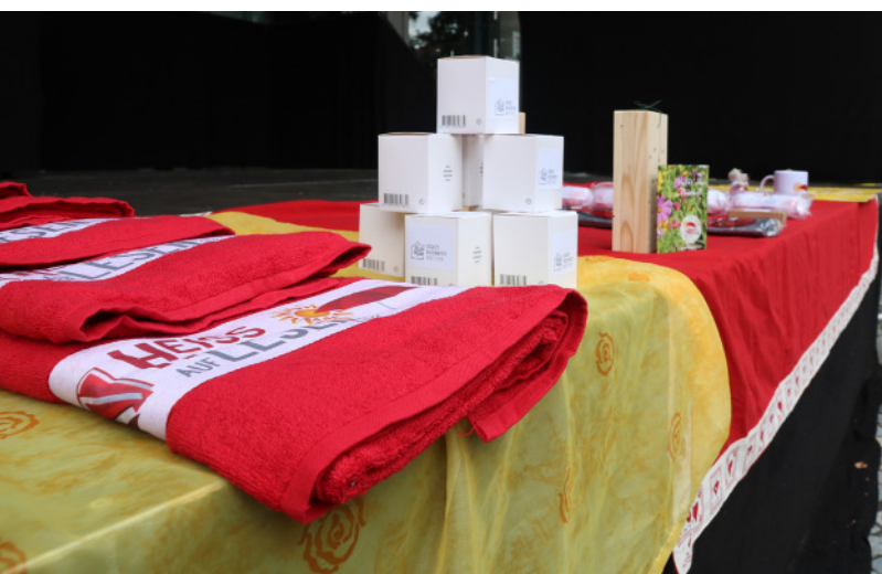
Strand-Badetücher, Lautsprecher und Bienenhotels: für die Kinder gab es bei der Heiß-auf-Lesen-Reading-Challenge viel zu gewinnen.