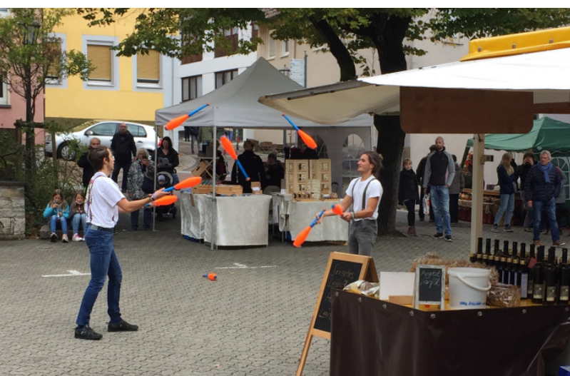
Am Sonntag bieten über 30 Kunsthandwerker auf dem Kirchplatz und dem Alfred-Leicht-Platz handgemachte Unikate und kunstvolle Einzelstücke begleitet von abwechslungsreichen Programmpunkten.

„Kunst und Genuss“ lädt am Wochenende vom 24. bis 26. September mit einem Mix aus Kunst, Genuss und Musik zum Genießen und Entdecken in die Brettener Innenstadt ein. Zahlreiche Weingüter und Winzer der Region, präsentieren am Seedamm ein vielfältiges Weinangebot. Gemütliche Sitzcken und ein kleines kulinarisches Angebot sorgen für entspannte Stunden unter freiem Himmel. Für den Einlass in den Weinbereich werden die 3-G-Regelung und die Kontaktnachverfolgung durch die Luca App angewendet. Längere Öffnungszeiten des Einzelhandels am Samstag, der verkaufsoffene Sonntag mit Kunsthandwerkermarkt und Oldtimerausstellung, dazu Musik- und Kunst von rund 15 Künstlern unterhalten die Besucher an diesem Wochenende. Für die kleinen Gäste gibt es ein kreatives Angebot sowie ein Kinderkarussell welches auf dem Volksbankparkplatz in der Fußgängerzone am Samstag und am Sonntag seine Runden dreht. Durch die Verteilung der Stände und die Aufteilung der verschiedenen Bereiche, ergibt sich ein weitläufiger Rundlauf mit zahlreichen Aktionen bei dem Jung und Alt zu einem unterhaltsamen Besuch in die Innenstadt eingeladen werden.