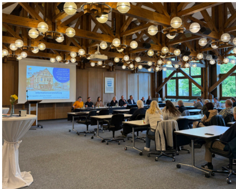
Zahlreiche Eigentümerinnen und Eigentümer informieren sich bei der Veranstaltung über Fördermöglichkeiten und Sanierungsmaßnahmen

Der Große Sitzungssaal im Rathaus war am Dienstagabend gut besucht. Eingeladen waren die Eigentümerinnen und Eigentümer der beiden Sanierungsgebiete „Westliche Vorstadt“ und „Stadtumbau“. Im Mittelpunkt der nichtöffentlichen Informationsveranstaltung standen die Möglichkeiten der Städtebauförderung sowie konkrete Unterstützungsangebote für private Sanierungsvorhaben. Oberbürgermeister Nico Morast eröffnete die Veranstaltung und betonte die große Chance, die die Städtebauförderung sowohl für die Entwicklung der Stadt als auch für private Eigentümer bietet. Die fachliche Begleitung der Sanierungsmaßnahmen übernimmt die STEG als externer Sanierungsträger der Stadt. Im anschließenden Fachvortrag erläuterte STEG-Projektleiterin Frau Franzen die rechtlichen Grundlagen der Städtebauförderung und die Voraussetzungen für private Maßnahmen. Die Städtebauförderung wird gemeinsam von Bund, Ländern und Kommunen getra-