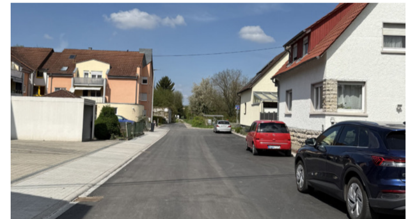
Blick auf die fertig sanierte Brühlstraße in Diedelsheim nach Abschluss der Bauarbeiten zur Modernisierung der Infrastruktur

In Bretten wird gebaut, saniert und investiert und das sichtbar: in der Kernstadt und in unseren Stadtteilen. Im Rahmen einer Baustellenrundfahrt mit Vertretern der Presse hat OB Nico Morast mit weiteren Vertretern der Stadtverwaltung die zahlreichen aktuellen und abgeschlossenen Maßnahmen vorgestellt. Ziel ist es, transparent über Hintergründe, Zeitpläne und Kosten zu informieren.