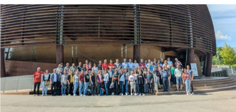
Musikerinnen und Musiker aus Bretten und Bellegarde am CERN in Genf