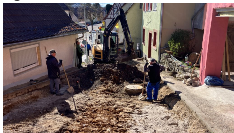
Bagger- und Straßenbauarbeiten während des Vollaubs

Im Frühjahr dieses Jahres wurde die Straße „Am Bromberg“ in Sprantal im Vollausbau erneuert. Die Baumaßnahme stellte aufgrund der starken Steigung der Straße besondere Anforderungen an alle Beteiligten. Zusätzlich erschwerte die Lage der Baustelle die Arbeiten, da sich oberhalb der Straße kein öffentlicher Weg befindet. Trotz dieser Herausforderungen konnten die Arbeiten erfolgreich und planmäßig durchgeführt werden. Ein herzlicher Dank gilt den Anwohnerinnen und Anwohnern für ihr Verständnis sowie der ausführenden Firma Sauer für die gute Zusammenarbeit und den reibungslosen Bauablauf. Im Zuge der Maßnahme erneuerten die Stadtwerke zudem den letz-