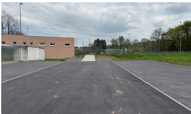
Die neuen Stellplätze am Kunstrasenplatz in Diedelsheim

In Bretten wird gebaut, saniert und investiert und das sichtbar: in der Kernstadt und in unseren Stadtteilen. Im Rahmen einer Baustellenrundfahrt mit Vertretern der Presse hat OB Nico Morast mit weiteren Vertretern der Stadtverwaltung die zahlreichen aktuellen und abgeschlossenen Maßnahmen vorgestellt. Ziel ist es, transparent über Hintergründe, Zeitpläne und Kosten zu informieren.