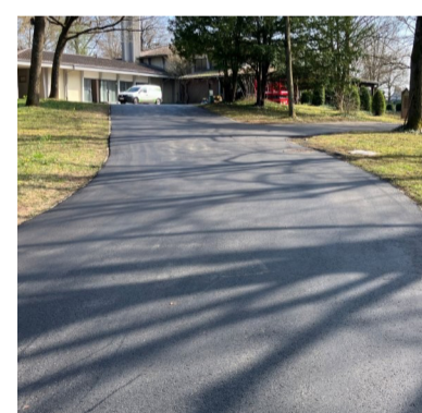
Die sanierte Zufahrt zur Aussegnungshalle auf dem Friedhof Bretten

schließend erhielt die Zufahrt eine neue Asphaltdecke. Dadurch konnte die Fläche sowohl funktional als auch optisch deutlich aufgewertet werden. Mit der Sanierung wurde die Erreichbarkeit der Aussegnungshalle nachhaltig verbessert und zugleich ein wichtiger Beitrag zum langfristigen Erhalt der Friedhofsinfrastruktur geleistet. Die Kosten für die Erneuerung der Zufahrt belaufen sich auf rund 23.000 Euro. (red)