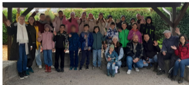
Die Helfer der GS Bauerbach beim Umweltsatz