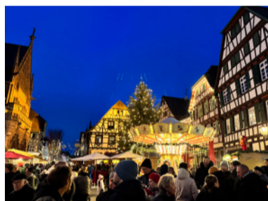
Der Brettener Marktplatz erstrahlt in weihnachtlichem Glanz.

Für Familien und Kinder wartet zudem ein liebevoll gestaltetes Rahmenprogramm: Der neue Christkindlesbriefkasten lädt ein, Wunschzettel und Bilder an das Christkind zu schicken, und in der Bastelhütte können die Kleinen kreativ werden. Ergänzt wird das Angebot durch den Kunsthandwerkermarkt, auf dem mehr als 30 Ausstellerinnen und Aussteller handgefertigte Unikate präsentieren. Dieser findet nochmals vom 12. bis 14. Dezember auf dem Kirchplatz statt. (er)