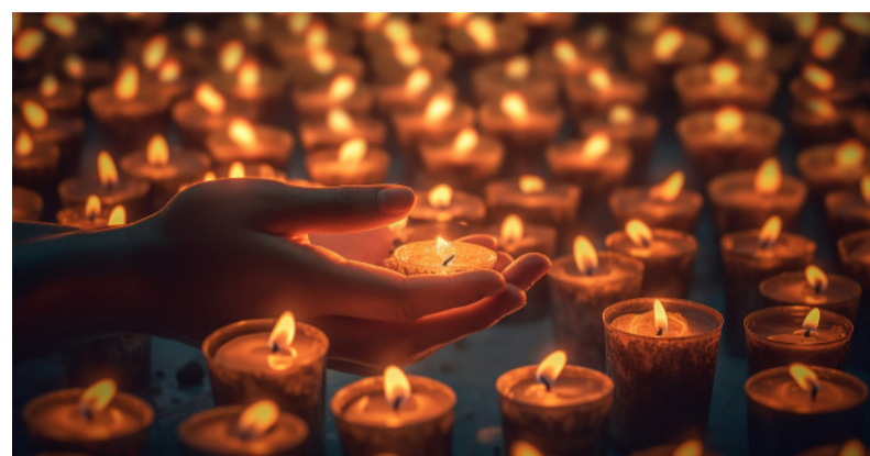
Am 16. Dezember wird das Friedenslicht im Rathaus weitergereicht.

Tradition und der Gemeinderatssitzung teilzunehmen. Das Friedenslicht stammt aus der Geburtsgrube Christi in Bethlehem. Nach dem Sitzungsende können Besucher und Gemeinderatsmitglieder das Friedenslicht nach Hause mitnehmen, um dieses an Freundes- und Bekanntenkreise zu verteilen. (red)