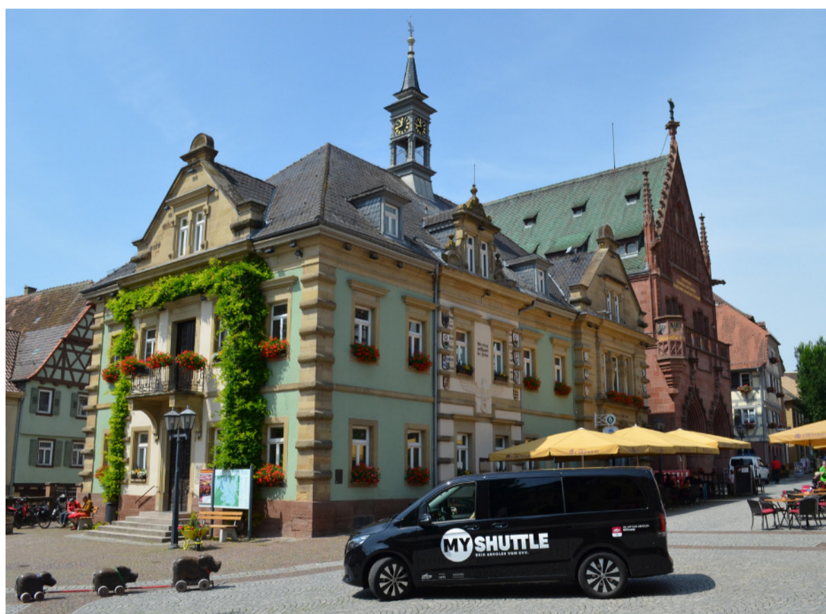
Dieses Foto zeigt exemplarisch ein KVV.MyShuttle auf dem Brettener Marktplatz vor dem Alten Rathaus. Ab 15. Dezember werden die Fahrzeuge im gesamten Stadtgebiet zu sehen sein.

Wir beantworten die wichtigsten Fragen zum neuen On-Demand-Angebot für Bretten