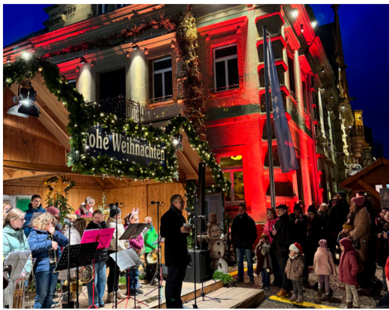
OB Nico Morast eröffnete den Brettener Weihnachtsmarkt am vergangenen Freitag.