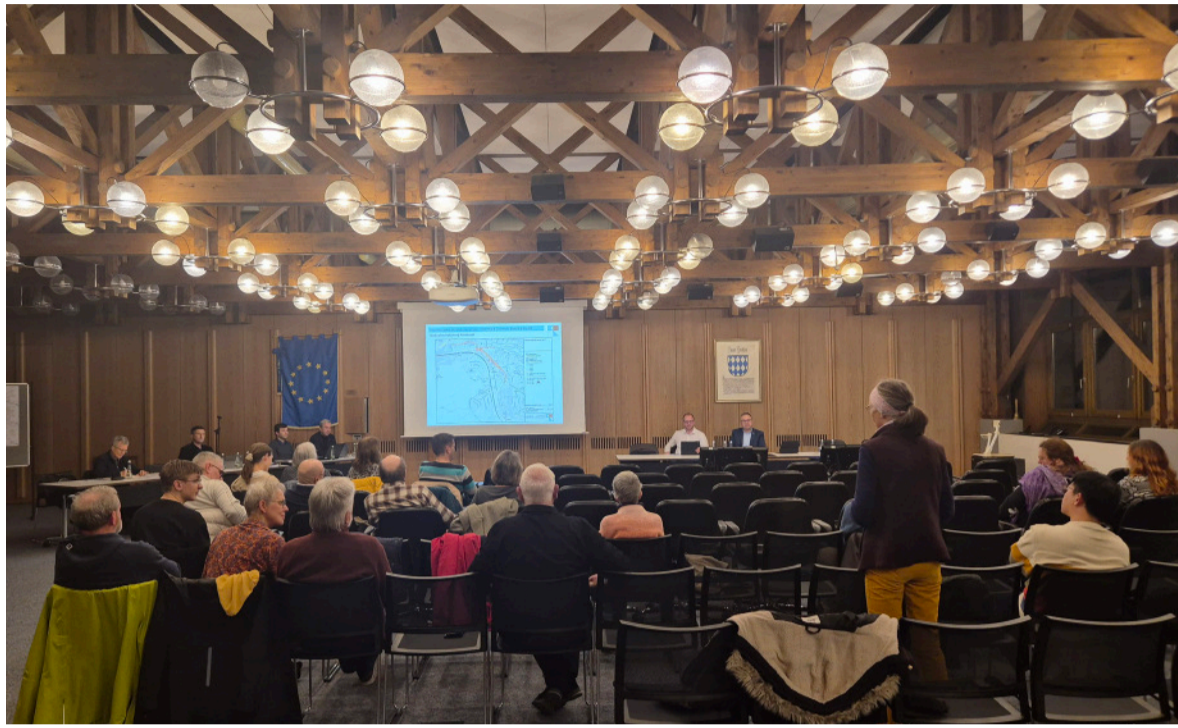
Rund zwei Dutzend Brettener Bürgerinnen und Bürger waren am Montagabend ins Rathaus gekommen, um sich aus erster Hand über die Lärmaktionsplanung der Stadt Bretten zu informieren und zu diskutieren.