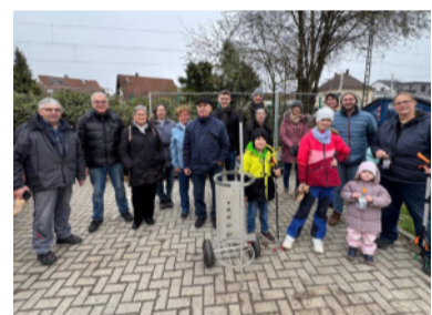
Helferinnen und Helfer nach erfolgreicher Dorfputzede

Erfolgreiche Dorfputzede mit großer Beteiligung Auch in diesem Jahr war die Dorfputzede in Diedelsheim ein voller Erfolg. Mehr als 100 engagierte Bürgerinnen und Bürger beteiligten sich an der Aktion und setzten damit ein starkes Zeichen für eine saubere und lebenswerte Umgebung. Den Auftakt machte am Montag die Jugendfeuerwehr. Von Dienstag bis Donnerstag waren die Schülerinnen und Schüler der Schwandorfschule sowie der Pestalozzischule im Einsatz und sammelten mit großem Eifer Müll. Am Freitag beteiligten sich der Bürgerverein sowie das Ehepaar Stanja an der Reinigungsaktion. Den Abschluss bildete schließlich der Samstag, an dem der Ortschaftsrat, der Jugendgemeinderat sowie zahlreiche weitere Helferinnen und Helfer tatkräftig mit anpackten. Ausgestattet mit Greifzangen und Handschuhen machten sich die Teilnehmenden ans Werk, sodass sich die Müllsäcke schnell füllten. Am Ende kam eine beachtliche Menge an Abfall zusammen, die vom Bauhof an der zentralen Sammelstelle abgeholt wurde. Ortsvorsteher Kern zeigte sich erfreut über die große Resonanz und bedankte sich herzlich bei allen Beteiligten für ihren Einsatz und das vorbildliche Engagement für die Gemeinschaft.