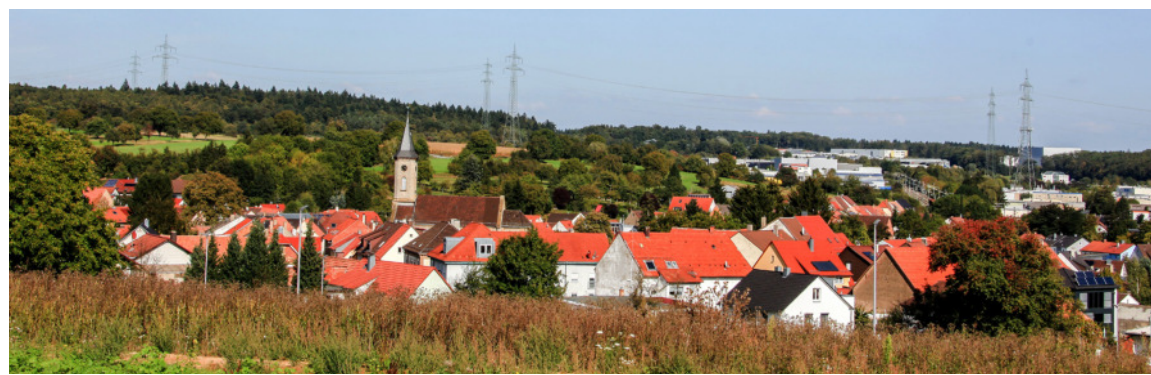
Die Gölshäuser Wanderwege bieten malerische Ausblicke auf den Stadtteil.