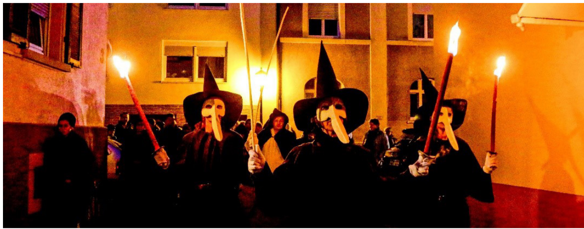
Pestführung der Gramboler

Am 18. April 2026 lädt die Mittelaltergruppe „die Gramboler“ zu einem schaurig-schönen Rundgang durch die historischen Gassen von Bretten ein. Die Teilnehmer begeben sich auf eine Reise in die düsterste Zeit des Mittelalters, als der „Schwarze Tod“ über Europa hereinbrach und tausende von Menschenleben forderte. Historische Hintergründe und lebendige Szenen lassen die Schrecken und Ängste dieser Epoche spürbar werden. Eindrucksvolle Inszenierungen und historische Fakten lassen diese Zeit lebendig werden: Verunstaltete Gestalten, verängstigte Bürger und Gelehrte zeigen, wie die Seuche das Leben und Sterben der Menschen prägte. Der Rundgang startet am Alfred-Leicht-Platz, führt durch