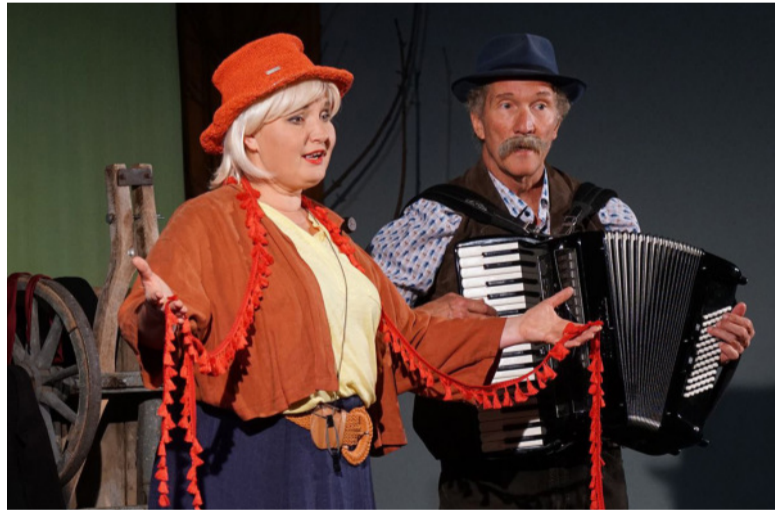
Schauspieler beim Stück „Auf Achse“

Publikum auf eine musikalisch-literarische Reise. Das Stück ist eine moderne Hommage an den griechischen Dichter Thespis, der einst mit einem Karren als mobile Bühne durchs Land zog. Eintrittskarten kosten 18 € (ermäßig 16 €) und sind im Vorverkauf bei der Tourist-Info Bretten sowie an der Abendkasse erhältlich. Die Veranstaltung wird aus Landesmitteln durch die Arbeitsstelle für literarische Museen in Baden-Württemberg unterstützt. (red)