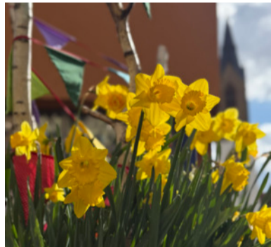
Frühlingshaft bepflanzte Kübel schmücken die Innenstadt

Auch die Wochenmärkte sind erfolgreich in die neue Saison gestartet. Ob in den Stadtteilen oder auf dem Marktplatz - mittwochs und samstags herrscht eine fröhliche, frühlingshafte Atmosphäre. Besonders beliebt sind auch die Abendmärkte, bei denen sonnige Stunden und milde Temperaturen zum Verweilen einladen. Hier trifft man sich, genießt regionale