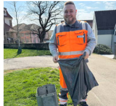
Für eine saubere Stadt im Einsatz

Am kommenden Wochenende startet mit dem Wanderopening in Gölshausen offiziell die Wander-