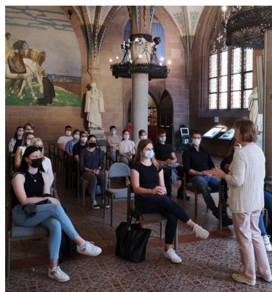
Im Rahmen der Einführungswoche erhielten die Auszubildenden und FSJler einen Überblick über die Stadtverwaltung als ihren Arbeitgeber sowie die Stadt Bretten und hatten während des Teambuildings bei der Rinklinger Grillhütte viel Spaß.