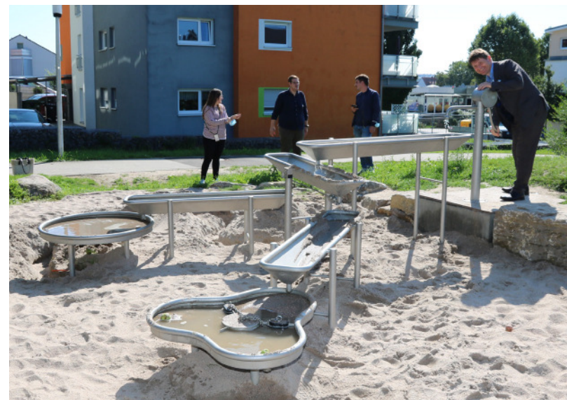
Auf dem Spielplatz „Brunnenstube“ wurde in diesem Jahr ein neues, wartungsarmes Wasserspielgerät aus Edelstahl installiert.

beschacht und Leitung hergestellt werden, was rund die Hälfte der insgesamt 35.000 Euro Kosten ausgemacht hat. Nun ist dieser Bereich für viele Jahre nutzbar und bietet nicht nur die Möglichkeit mit Wasser, sondern auch mit Matsch zu spielen. Auch hier wurde besonderen Wert auf die Ökologie der Anlage gelegt. Das Wasser versickert umweltfreundlich in den Grünflächen, die bewusst Nahrung und Lebensraum für viele Insekten bieten und erst abgemäht werden, wenn sich die Samen nach der Blüte verbreiten konnten.