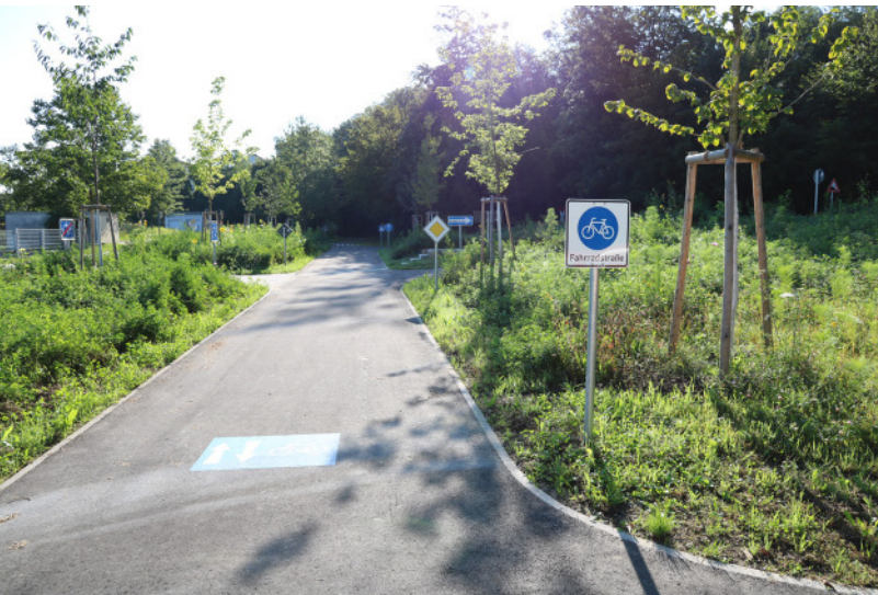
Die aktuelle Erweiterung des Jugendverkehrsübungsplatzes, mit unter anderem einer Fahrradstraße und einem Bahnübergang, ermöglicht nun auch das Üben mit größerer Geschwindigkeit.