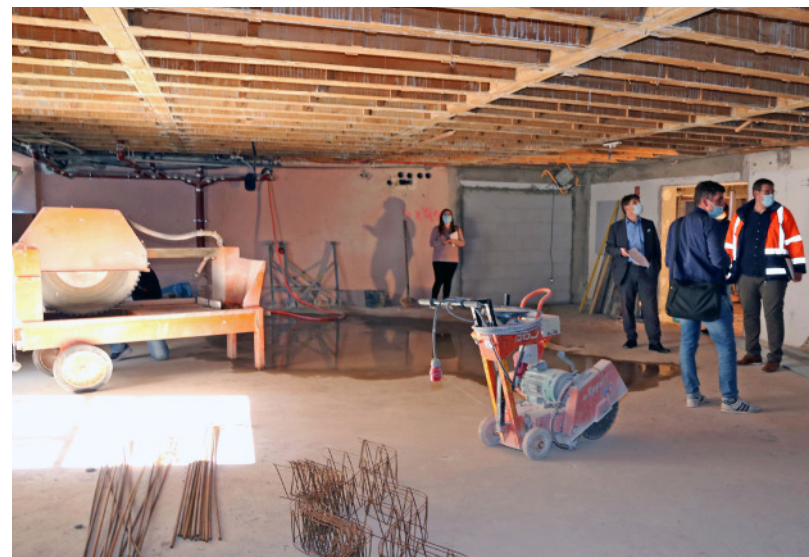
Im Rahmen der Sanierung wird die Sporthalle durch einen langen Flur mit dem großzügigen Big-Band-Raum verbunden, der hier noch im Rohbauzustand zu sehen ist.

befindet man sich in Bauabschnitt 1 mit großen Abbrucharbeiten in den beiden untersten Ebenen. Beispielsweise wurde das Treppenhaus, das diese beiden Ebenen verbunden hat, zurückgebaut und eine Zwischendecke eingezogen. Die beiden Ebenen werden zukünftig durch eine neue Treppe in direkter Nähe des Eingangsbereichs und zur halboffenen Mensa sowie durch einen Fahrstuhl miteinander verbunden. In der untersten Ebene wurde die Struktur komplett verändert. Die ehemals verwinkelte Anordnung wurde in einen langen Flur als Verbindung zwischen Sporthalle und dem großzügigen Big-Band-Raum abgeändert, von dem Umkleide- und Technikräume abgehen. Aktuell ist alles noch eingerüstet, auch die große Sporthalle, da dort gerade Arbeiten an der Decke ausgeführt werden und in Kürze folgt der Einbau des Estrichs. Die Maßnahme liegt damit voll im Zeitplan und wird bis Ende des Jahres beendet sein. Ab Januar können diese beiden Ebenen dann wieder von den Schülerinnen und Schülern genutzt werden und man beginnt mit dem zweiten Bauabschnitt.