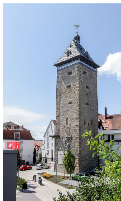
Historischer Pfeiferturm

Weitere Informationen zu den Führungen und Rundgängen sind bei der Tourist-Info Bretten oder unter www.erlebe-bretten.de erhältlich. Eine Anmeldung ist ebenfalls in der Tourist-Info (Tel. 07252 583710, tourist-info@bretten.de ) oder online über www.vhs-bretten.de möglich. (red)