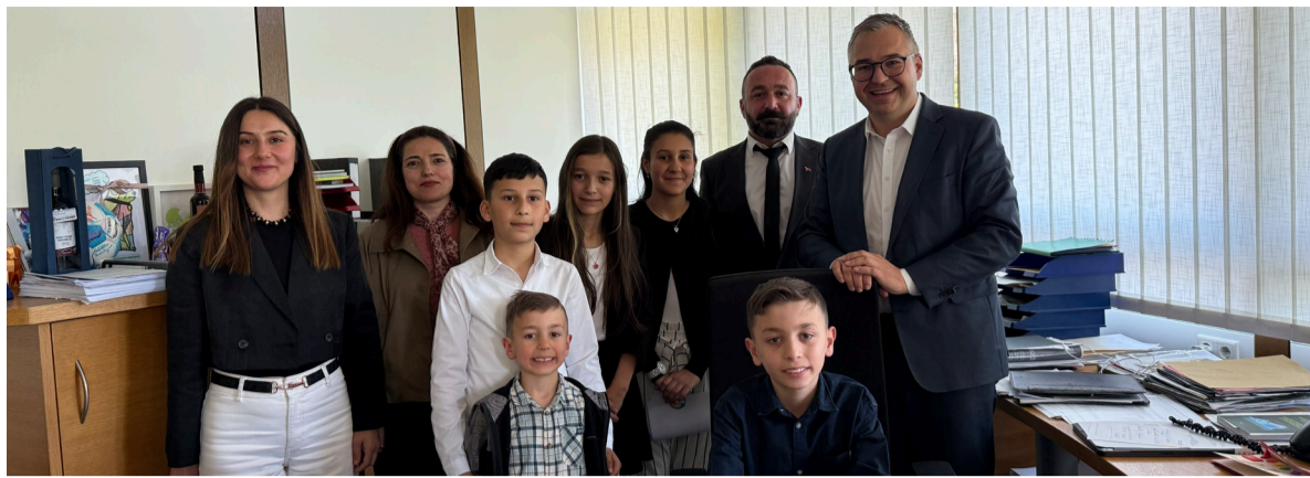
Schüler und Eltern freuten sich über den Austausch mit OB Nico Morast.