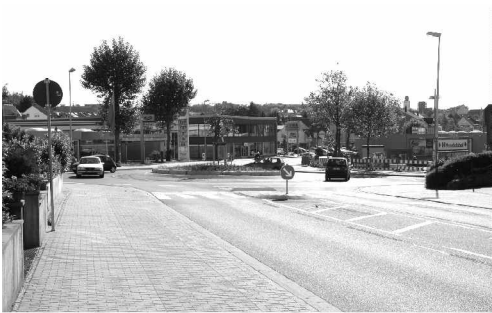
In Bretten „kreiselte“ es 2009 weiter. Nach dem „Ei“ bei der Musikschule und dem „Ball“ beim Kriechgauzentrum, wurde 2009 der Verkehr auf beiden Seiten des Handelshofs durch Kreisel flüssiger gestaltet und auch der „Kaiser“ auf seinem Denkmal kann sich nun freuen, wie sich der Verkehr dreht (- ärgern konnte er sich während der Bauphase....)