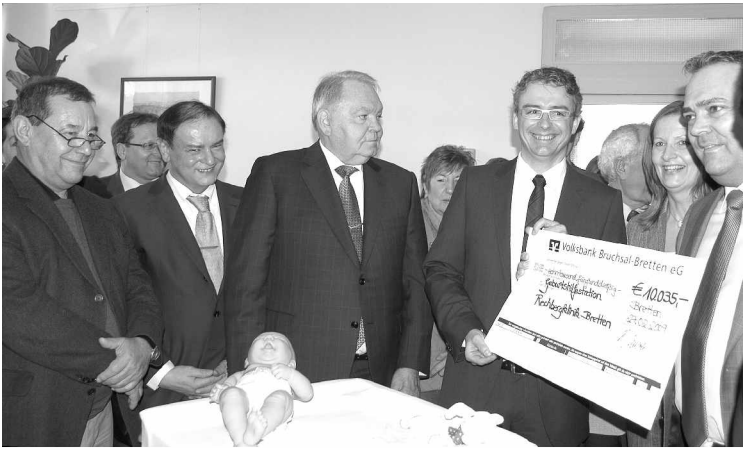
Da freuen sich (zukünftige) Mütter und Väter: Die vorübergehend geschlossene Geburtenabteilung der Reckbergklinik wurde 2009 wieder geöffnet. Zu diesem Anlass spendete die Firma Deurer mehr als 10.000 Euro