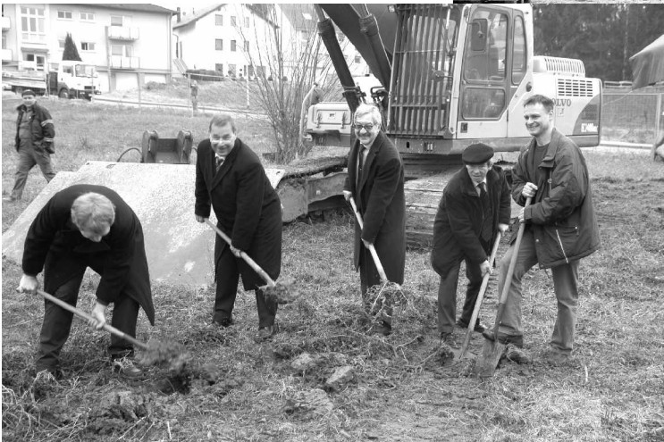
Im Dienste der nächsten Generation: Erster Spatenstich für das Kinderhaus „Im Brückle“ - auch für Kinder aus dem neuen Wohngebiet „Steiner Pfad“. Fertiggestellt wurde 2009 der neue Trakt des kreisigen beruflichen Bildungszentrums in Bretten.