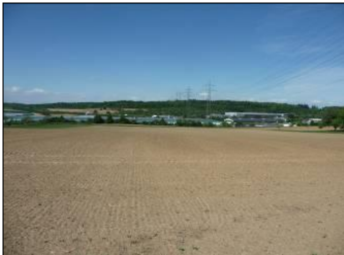
Abbildung 3: Blick auf die Ackerflächen in Richtung Norden

Durch die intensive Nutzung sind die Ackerflächen als ein mäßiges Nahrungshabitat für Vögel anzusehen. Im Grünland konnten keine Wirtspflanzen für geschützte Tag- und Nachtfalter vorgefunden werden. Unmittelbar westlich des Geltungsbereiches gibt es einen Hohlweg. Die Böschungsbereiche sind Lebensräume der Zauneidechse.