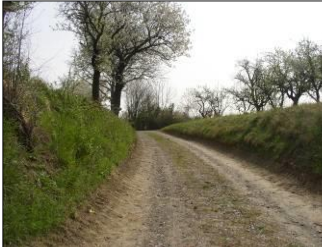
Abbildung 4: Blick auf den Hohlweg