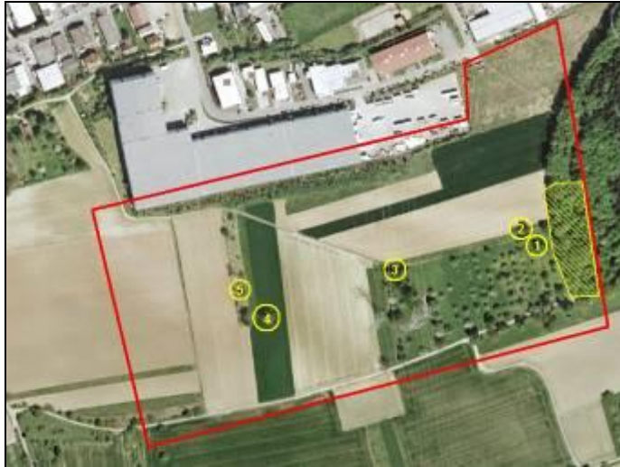
Abbildung 6: Übersicht der relevanten Höhlenbäume

(mit Nummern versehen); am Waldrand waren einige ältere Bäume mit Spalten vorhanden (schraffierter Bereich)