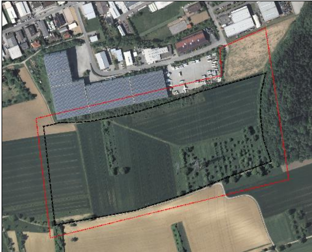
Abbildung 2: Untersuchungsraum mit Geltungsbereich des Bebauungsplans

Auf der nachfolgenden Abbildung ist der vorläufige Untersuchungsraum für die Relevanzuntersuchung mit Habitatpotenzialanalyse (rot umrandet) und der Geltungsbereich des Bebauungsplanvorentwurfs „Industriegebiet Gölshausen VII. Abschnitt“ (schwarz umrandet) abgebildet.