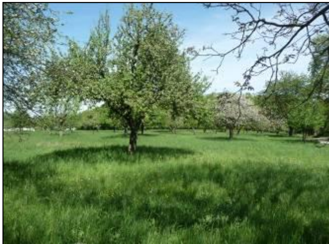
Abbildung 5: Blick auf den südöstlichen Streuobstbestand

Aufgrund ihres Früchte- und Insektenreichtums sind die Gehölze als ein Nahrungshabitat für die lokalen Vogelpopulationen einzuordnen.