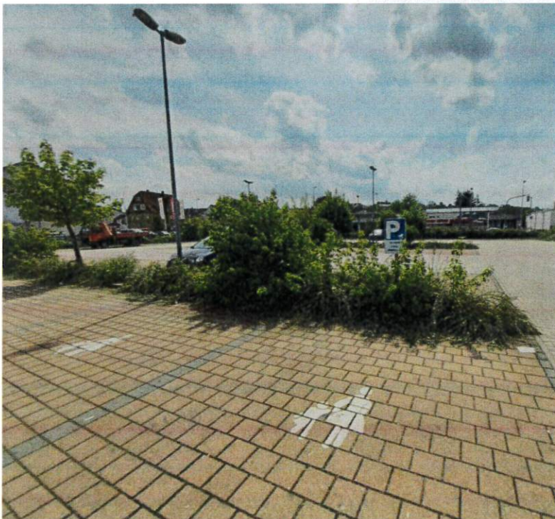
Abbildung 3: Parkplatz mit Vegetationsstreifen.