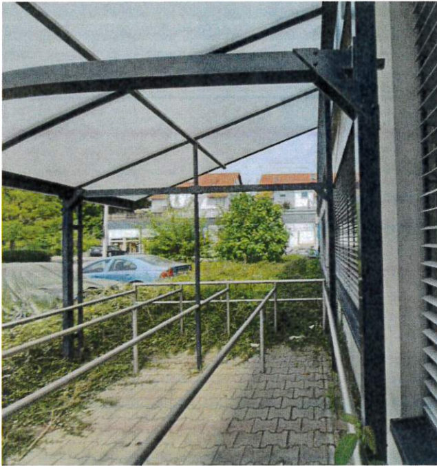
Abbildung 4: Gebüsch zwischen Parkplatz und Gebäude