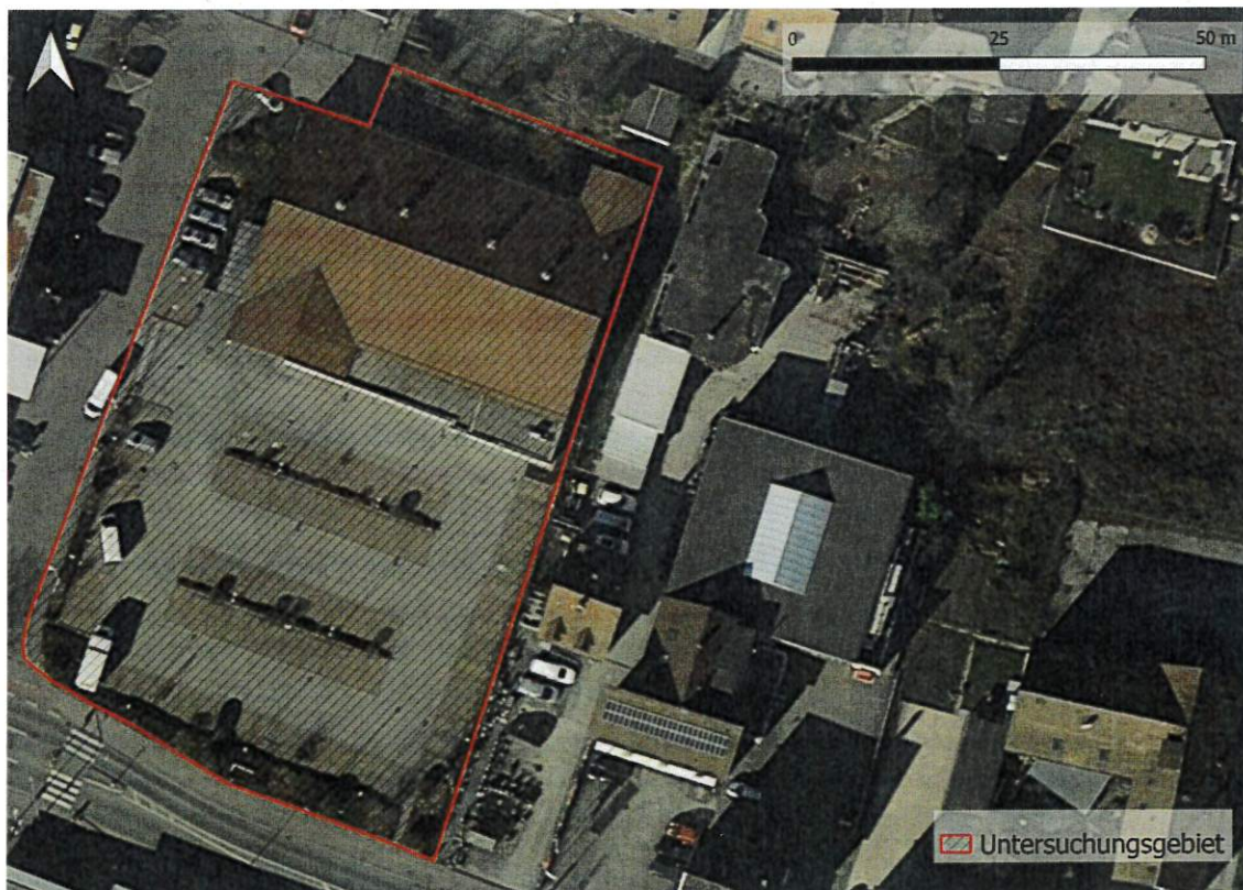
Abbildung 1: Übersichtskarte des Vorhabensbereiches (rot gekennzeichnet)

Aufgrund der möglichen Betroffenheit von geschützten Arten auf dem Grundstück wurde der zu erwartende Eingriffsbereich am 10.05.2022 sowie am 09.06.2022 begangen, um anhand der vorgefundenen Habitat- und Strukturausstattung mögliche Vorkommen planungsrelevanter Arten abzuschätzen. Außerdem wurde der Untersuchungsbereich nach direkten und indirekten Hinweisen einer Besiedlung abgesucht.