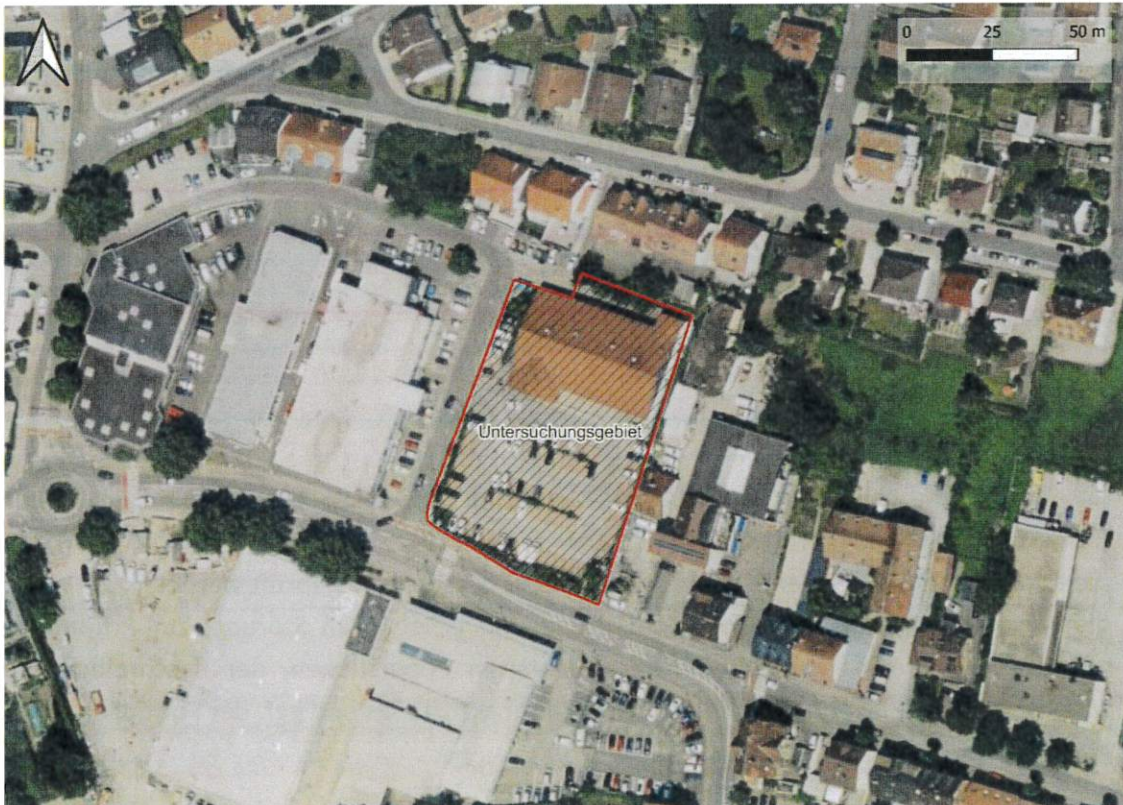
Abbildung 2: Lage des Untersuchungsgebietes (rot gekennzeichnet).

Es befinden sich keine Schutzgebiete oder gesetzlich geschützte Biotopie in der Nähe des Untersuchungsgebiets.