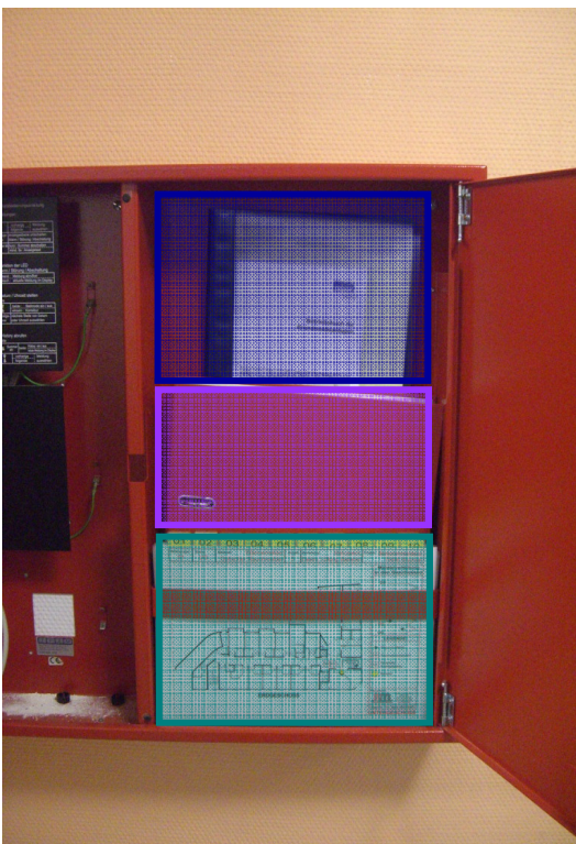
Betriebsbuch für Brandmeldeanlagen Feuerwehrpläne Feuerwehr-Laufkarten