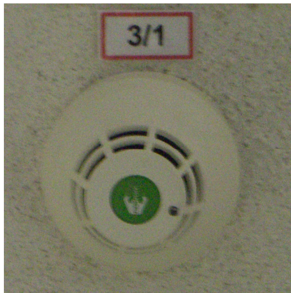
Beschilderung Meldergruppennummer / Meldernummer