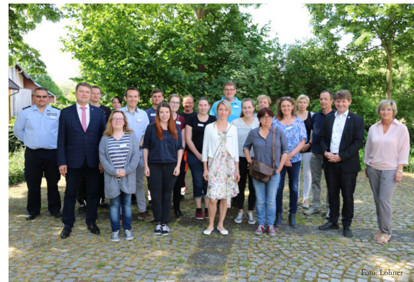
Die Verwaltungsspitze begrüßte die neuen Mitarbeiter bei einem Willkommensfrühstück.