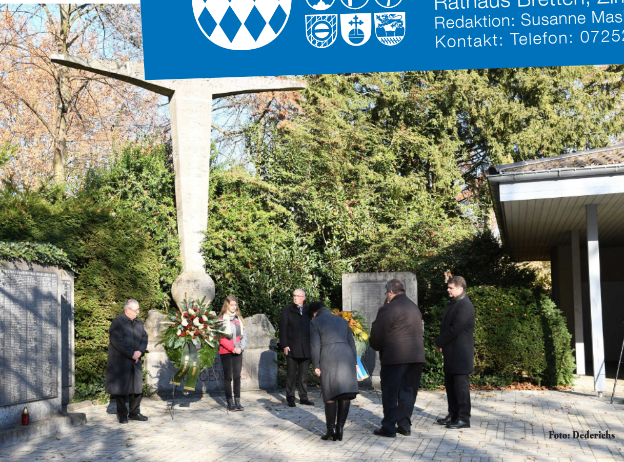
Kranzniederlegung auf dem Hauptfriedhof in Bretten am Volkstrauertag.