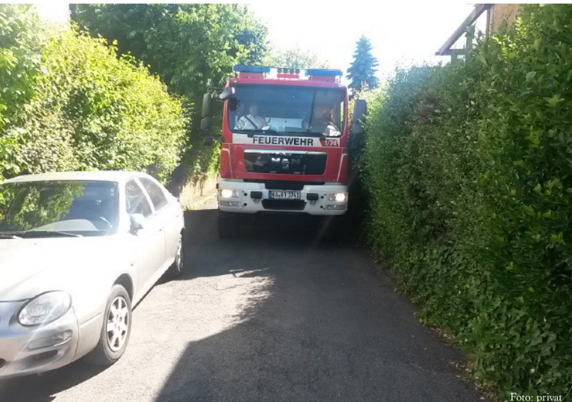
Zugparkt: Kein Durchkommen für das Einsatzfahrzeug der Feuerwehr.