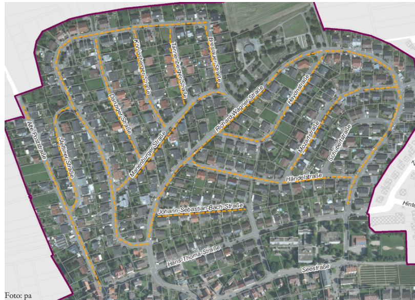
Thermografiegebiet im Stadtteil Diedelsheim.

Im Rahmen des integrierten Quartierskonzeptes „zeozweifrei im Quartier“ werden von ca. 360 Gebäuden, mit Hilfe einer Wärmebildkamera, Außenaufnahmen von der Gebäudehülle gemacht. Thermografie-Aufnahmen sind Infrarotmessungen, die die Oberflächentemperatur von Bauteilen sichtbar machen und mit Hilfe eines farbigen Wärmebildes darstellen. Diese helfen dabei, energetische Schwachstellen und die Qualität von Gebäudehüllen zu ermitteln. Optimal erstellt werden Wärmebilder bei unter fünf Grad Celsius und geeigneter Tageszeit. Die Thermografie-Aktion wird in der Kalenderwoche 9 (der genaue Tag wird je nach Wetter ausgewählt) nördlich der Hans-Thoma-Straße stattfinden (siehe Karte). Die Aufnahmen erhalten Sie nach Fertigstellung bei der Stadt Bretten, genauere Informationen folgen. Weniger Energiekosten, weniger Schadstoffe – mehr vom Leben!