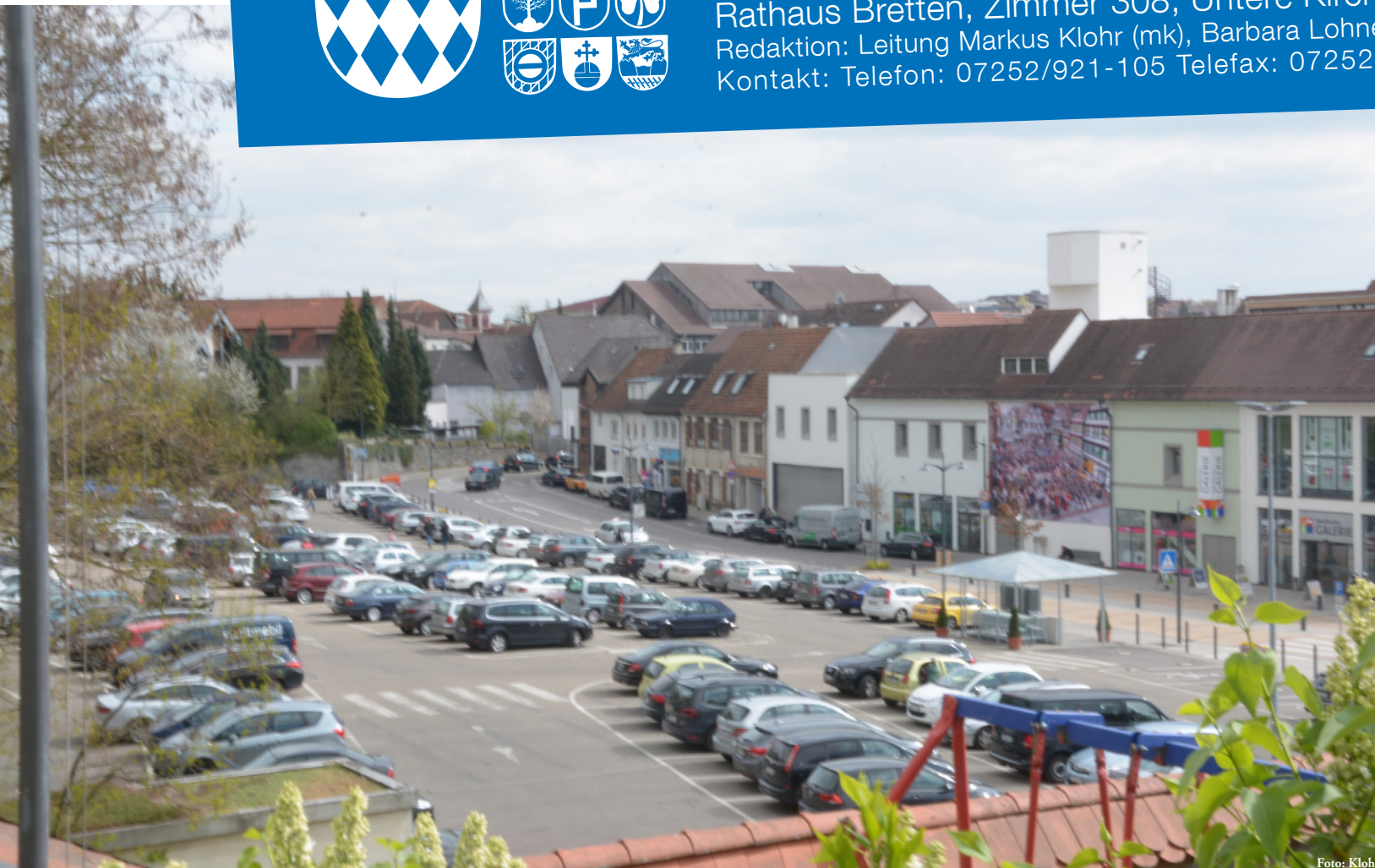
Vom Parkplatz zur Piazza? Das Sporgassen-Areal birgt ein großes Potenzial für die Entwicklung der Brettener Innenstadt.