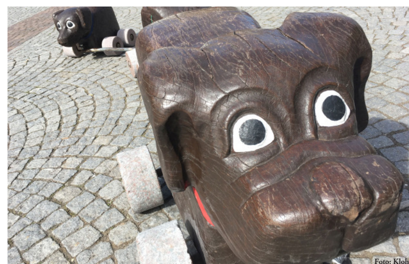
Hurra! Die Hundle sind wieder da und laden zur Innenstadt-Tour ein...

Alle öffentlichen Sitzungsvorlagen dieser und vergangener Gemeinderatssitzungen können Sie grundsätzlich ab mittwochs vor dem Sitzungstag unter www.bretten.de/stadt-rathaus-verwaltung/gemeinderat unter dem Link "Bürgerinfoportal" online abrufen. Kontakt: 07252/921-108