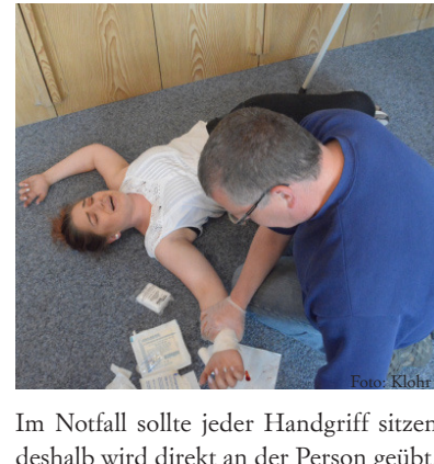
Im Notfall sollte jeder Handgriff sitzen, deshalb wird direkt an der Person geübt.