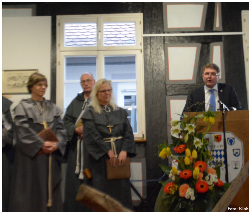
Oberbürgermeister Wolff bei der Ausstellungseröffnung im Stadtmuseum.

engen Kooperation mit Bruchsal als Plankrankenhaus“, so Wolff weiter. Personalentscheidungen wie diese seien „ein wichtiger Schritt, um die medizinische Versorgung hier in der Stadt weiter auf hohem Niveau zu halten.“ Im Zusammenwirken mit den beiden Kliniken für Innere Medizin in Bruchsal soll mittel- bis langfristig das Leistungsspektrum der Inneren Medizin innerhalb der Kliniken des Landkreises Karlsruhe noch besser abgestimmt und in der Rechbergklinik Bretten weiter ausgebaut werden. pm