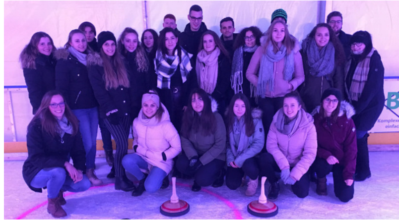
Beim Eisstockschießen konnten die Azubis und FSJler ihr Können unter Beweis stellen.

Vergangenen Donnerstag fand die bereits zur Tradition gewordene Weihnachtsfeier der Auszubildenden und FSJler der Stadtverwaltung Bretten statt, um im Team ein paar gemütliche Stunden zu verbringen und das Jahr gemeinsam ausklingen zu lassen.