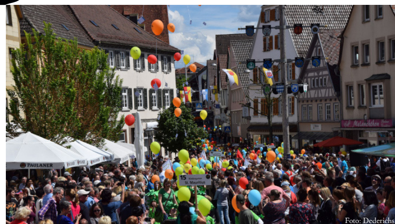
Mit bunten Luftballons zogen die Kinder beim Kinderumzug durch Bretten.