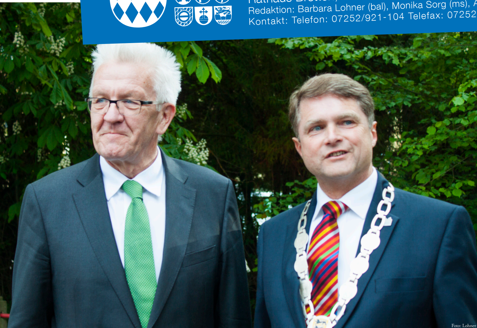
Zum offiziellen Festakt am Freitagabend war Ministerpräsident Winfried Kretschmann zu Gast in Bretten. OB Wolff nahm ihn vor dem Festzelt in Empfang.