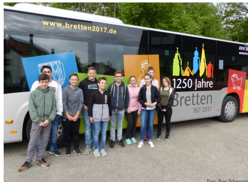
Die Firma Wöhrle brachte die Schüler mit dem Jubiläumsbus nach Gondelsheim.