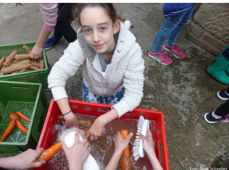
Die Schüler bereiten das aussortierte Gemüse für die Schnippeldisko vor.

Zu klein, zu groß, zu dick, zu dünn und obendrein noch krumm – auch Gemüse scheint Modelmaßen genügen zu müssen, um die Normen des Handels und den Wunsch nach Perfektion der Konsumenten erfüllen zu können. Aber ist es deswegen ungenießbar und schmeckt nicht mehr? Warum werden diese Lebensmittel aussortiert und landen sogar im Müll? Diesen Fragen gingen insgesamt 50 Schüler und Schülerinnen der 6. Klasse des Edith Stein Gymnasiums und der 7. Klasse der Max Planck Realschule Bretten auf den Grund. Bei einer Erntetour für die Schnippeldisko von Slow Food im Rahmen des großen Jubiläumswochenendes besuchten die Jugendlichen mit ihren Lehrern Bio-Bauern Gärtnerehof Kohler in Gondelsheim und den Baumbachhof der Familie Bonnet in Kleinvillars.