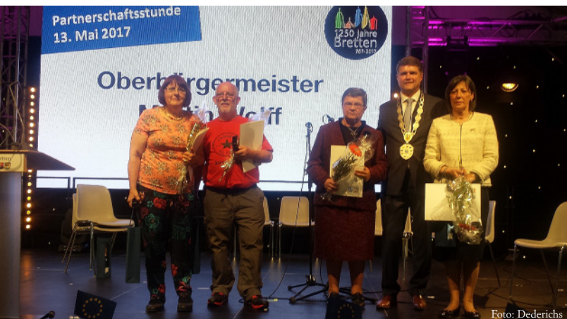
OB Wolff hat die Goldene Ehrennadel an Vertreter der Partnerstädte verliehen.

Seit Jahrzehnten lebt Bretten aktive Partnerschaften mit Städten in Portugal, Wales, Ungarn, Frankreich und Deutschland. Aus jeder dieser Partnerstädte kamen am Festwochenende Delegationen nach Bretten, um mit den Bürgern hier zu feiern; mit einer offiziellen Partnerschaftsstunde vertiefte die Stadt Bretten ihre Freundschaft zu den Partnerstädten. Musikalisch bereicherten die Gäste selbst das Geschehen: Portugiesische Mandolinenklänge und Gitarren der Mandolinengruppe aus Condeixa-a-Nova, begleitet wurden sie dabei vom Klatschen der Besucher aus Wales. Die Waliser selbst zeigten sich auch noch musikalisch: Glockenheller Chorgesang, begleitet vom Keyboard, kam vom Chor MelloD