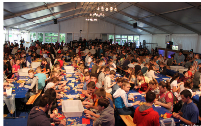
Über 600 Schüler haben bei der Schnippeldisko am Montag teilgenommen.