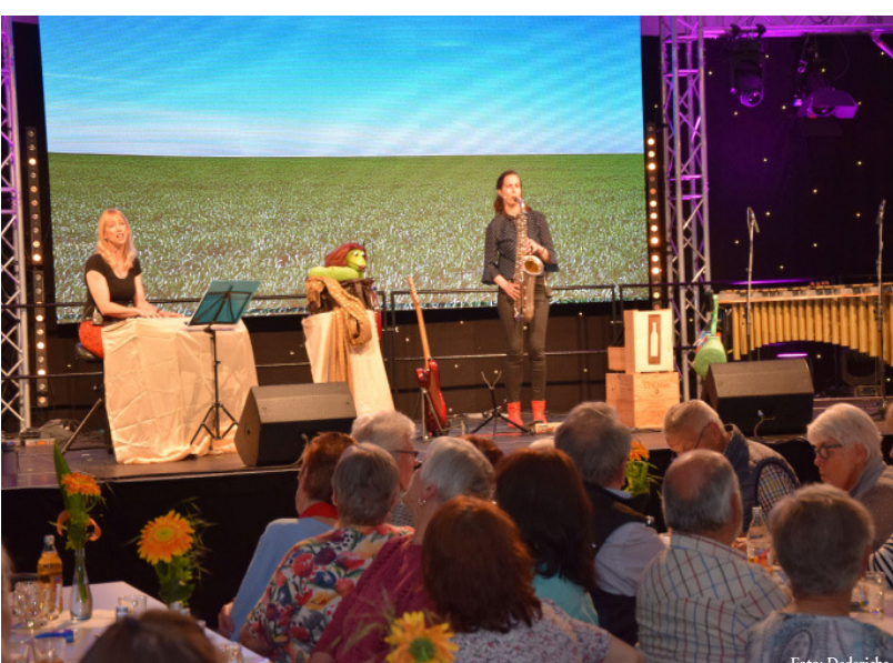
Das Kabarett „Dulabi“ nahm die Senioren im Festzelt auf eine musikalische Reise mit.