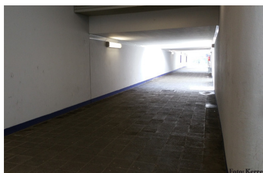
Momentan ist alles noch langweilig und grau, aber bald wird die Unterführung unter dem Motto „Bretten ist bunt“ zur (B)Unterführung.

Zum Stadtjubiläum 2017 gestaltet der Graffiti-Künstler René Sulzer zusammen mit Teilnehmern aus den verschiedenen Alters- und Bevölkerungsgruppen die Unterführung am Bretterer Bahnhof – einen der ersten Anlauforte der Stadt. Unter dem Motto „Bretten ist Bunt“ wird die Wand zu einem Ort der Begegnung. Die Gestaltung der Unterführung findet in der Woche vom 3. – 8. April, jeweils ab 13:00 Uhr statt. Vor der eigentlichen Gestaltung wird zur organisatorischen Absprache eine Infoveranstaltung am 16. März 2017 um 19:00 Uhr im Melanchthonstübli (Melanchthonstr. 3) durchgeführt. Interessierte Personen jeden Alters sind herzlich willkommen. Eine Teilnahme an dem Projekt ist kostenlos, Voraussetzung ist ein Mindestalter von 15 Jahren. Die Beteiligung ist an einem oder an mehreren Gestaltungstagen möglich. Eine Anmeldung über die Volkshochschule Bretten ist erforderlich (Tel. 07252 58371-8, vhs@bretten.de ), ebenso die Teilnahme an der Infoveranstaltung. pm