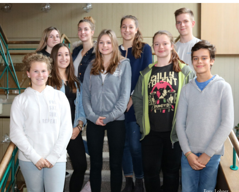
Neun der 13 Mitglieder des neu gewählten Jugendgemeinderats nach Bekanntgabe der Wahl-Ergebnisse.

Die Spannung war den anwesenden Kandidatinnen und Kandidaten bei der Auszählung der Jugendgemeinderatswahl-Ergebnisse am Montag nachmittag ins Gesicht geschrieben. Rund zwanzig Interessierte waren zur öffentlichen Auszählung gekommen.