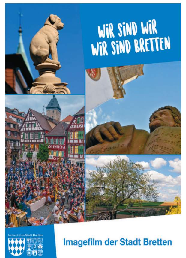
Imagefilm der Stadt Bretten