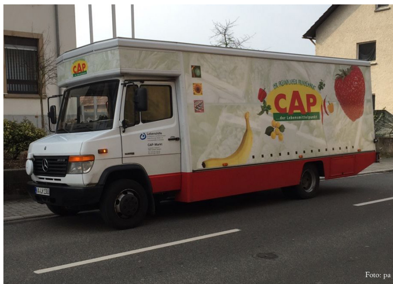
Das CAP-Mobil macht ab Montag, 18. Juni mit neuem Tourenplan in Bretten, Ruit und Sprantal Station.

Das CAP-Mobil der Lebenshilfe Bruchsal-Bretten macht ab 20. Juni jeweils mittwochs und samstags Station in Bretten, Ruit und Sprantal. Der Supermarkt auf Rädern verfügt über ein reichhaltiges Sortiment mit über 800 Artikeln und bietet einen freundlichen Service zu fairen Preisen. Das heißt: Die Käufer bezahlen den Ladenpreis, haben aber den Vorteil von kurzen Wegen - die Fahrt mit dem PKW zum nächsten Supermarkt entfällt. Mit dem Besuch im CAP-Mobil schonen die Käufer daher auch die Umwelt sparen Zeit und können sich noch selbst einkaufen, auch wenn sie nicht mehr so mobil sind. Seit nunmehr zehn Jahren stellt das