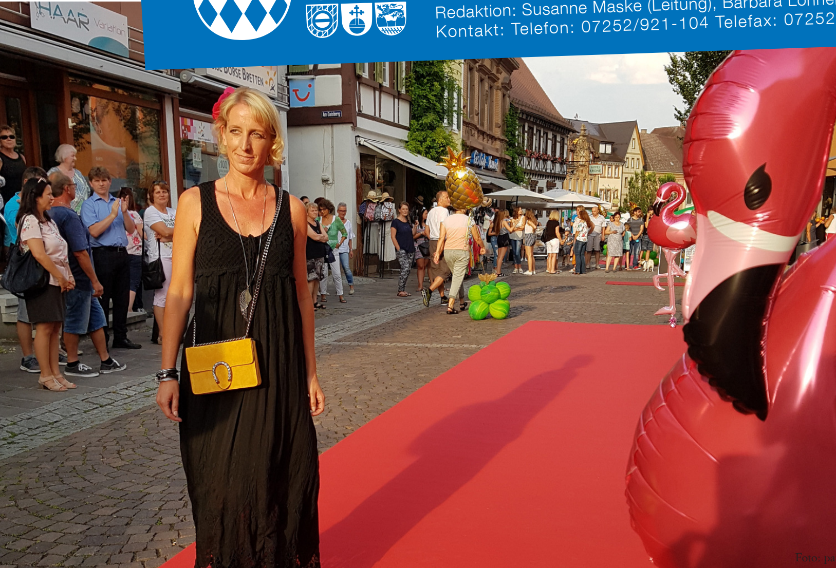
Bei der Sommer-Einkaufsnacht rollierte der rote Teppich, auf dem die Einzelhändler ihre Serviceleistungen und Produkte präsentierten, durch die Brettener Fußgängerzone.