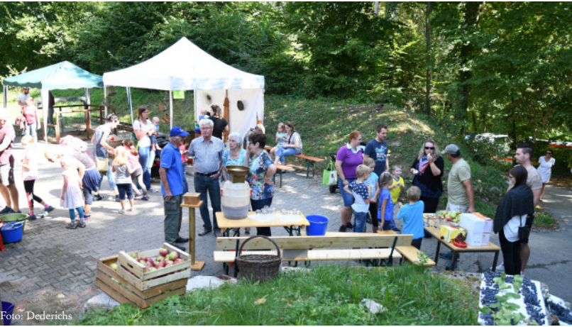
Die Kinder leben duft zahlreiche Kids beim Naturerlebnistag.

Im Unterholz kauert ein Marder, ein Kaninchen hockt neben einem Baum. Mit einem Maulwurf als Fang kehrt ein Mäusebussard von der Jagd zurück, und Fuchs und Wildschwein laufen über den Weg: Eine ganze Bandbreite heimischer Tiere konnten die Kinder beim Naturerlebnistag entdecken. Zugegeben: Es sind Präparate, die der Brettener Hegering im Wald versteckt hat, der Freude der Kleinen tat dies jedoch kaum einen Abbruch. Voller Eifer begaben sie sich auf die Pirsch und notierten fleißig ihre Entdeckungen.