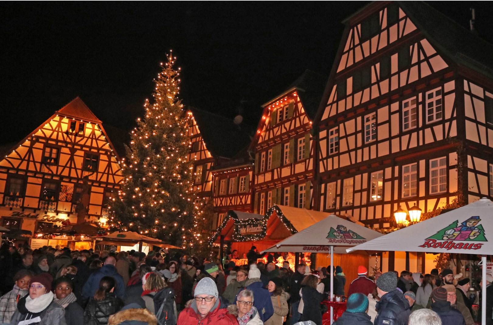
Das Fachwerkensemble auf dem Marktplatz erstrahlte im hellen Glanz der Lichter bei der Eröffnung des Weihnachtsmarktes.

Weihnachtsmarkt auf dem Marktplatz bis zum 22. Dezember 2019