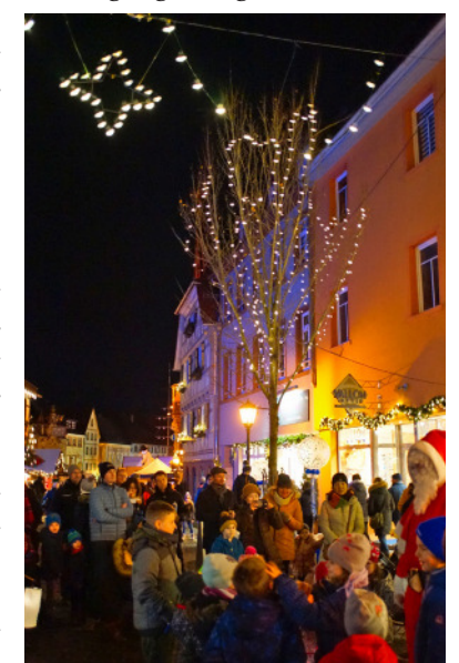
Gemeinsam mit dem Nikolaus zogen rund 70 Kinder mit bunten Lichtern und Laternen durch die Altstadt

Der Weihnachtsmarkt hat noch bis zum 22. Dezember 2019 geöffnet. An den kommenden beiden Wochenenden findet wieder der beliebte Kunsthandwerkermarkt auf dem Kirchplatz statt. Zudem wird bis einschließlich 5. Januar 2020 auf dem Marktplatz das Eislaufvergnügen angeboten.