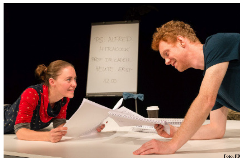
Die Badische Landesbühne bringt Hitchcock nach Bretten.

Der britische Filmregisseur und Filmproduzent Alfred Hitchcock war eine der schillerndsten Figuren des populären Kinos und ihm ist es gelungen, jenseits seines Berufes zu einer Figur der Zeitgeschichte zu werden. Wie nur wenige vor und nach ihm beeinflusste er das Medium Film, durch das er die absurden Seiten des menschlichen Lebens und dessen Abgründe offenlegte. Als Mensch aber blieb er trotz aller Vermarktungsstrategien um seine Person den meisten ein Unbekannter. Anlässlich der Uraufführung von Jack Trevor Storks Roman Ärger mit Harry, den Hitchcock 1955 als