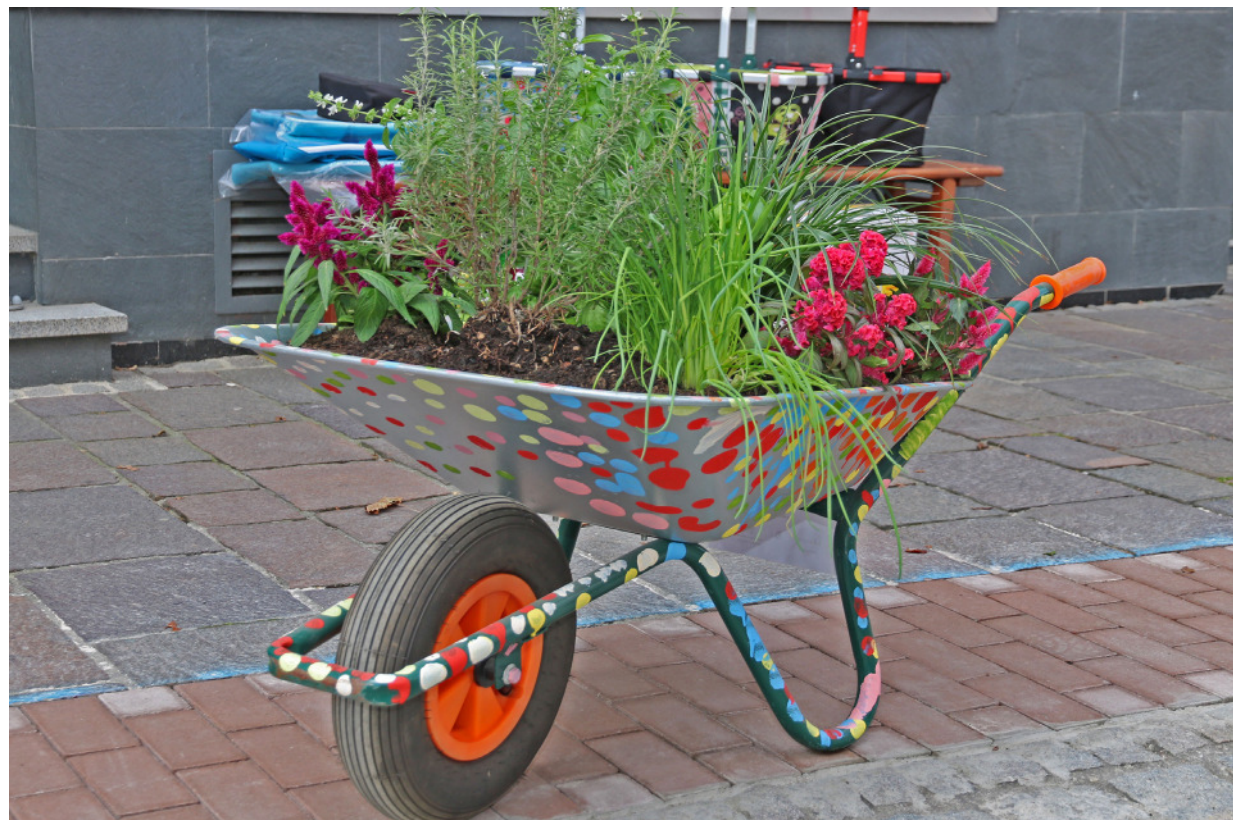
Etwas Farbe erhält die Brettener Innenstadt: In einer gemeinsamen Aktion des Stadtmarketings und der Interessengemeinschaft Brettener Innenstadt werden 15 bemalte und bepflanzte Schubkarren aufgestellt.