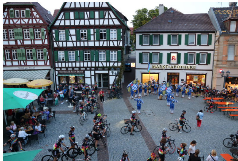
Der Fanfarenzug Bretten begrüßte die Rückkehrer am Abend auf dem Marktplatz.