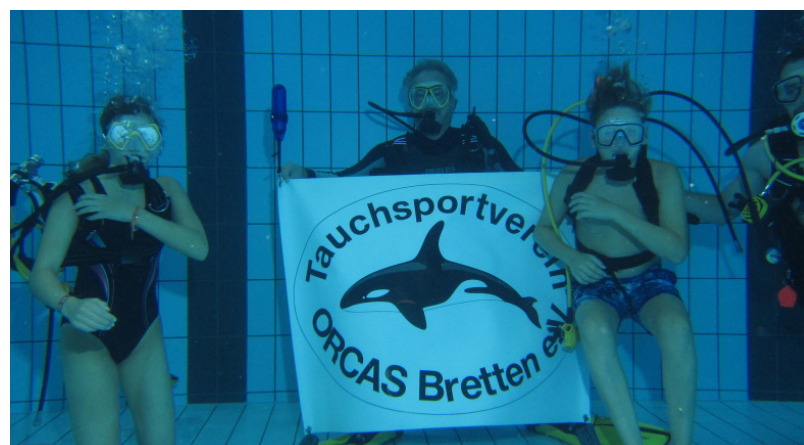
Tief hinunter ging es für die Kinder des Schnuppertauchens in der Badewelt Bretten

Kind wurde von einem erfahrenen Taucher einzeln begleitet. Nach kurzer Zeit konnten wir feststellen, dass die Kinder Vertrauen in die Technik und in die Betreuer gefasst hatten. Einige Kinder machten mit ihren Betreuern sogar Übungen, die man bei der Tauchausbildung durchführt. So war es bei vielen kein Problem die Maske unter Wasser ab und wieder aufzusetzen, oder den Atemregler mit dem Tauchpartner zu tauschen oder wechselweise mit nur einem Atemregler zu atmen. Der Tauchsportverein Orcas Bretten e.V. freut sich schon auf das nächste Jahr, denn wer einmal in die Augen der Kinder unter Wasser geschaut hat, der weiß welchen Spaß sie dabei hatten.