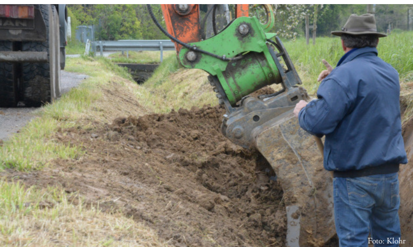
Stück für Stück: der Hungergraben ist ein wichtiger Mosaikstein im Hochwasserschutz.

Hochwasserschutz ist eine Daueraufgabe. Und dabei kommt es keineswegs nur auf die großen Millionenprojekte an. Hochwasserschutz ist auch Detailarbeit - das zeigt das Beispiel Hungergraben am Ortsrand von Bretten. Der Abwassergraben ist über die Jahre immer weiter zugewuchert. Zum allergrößten Teil des Jahres fließt dort zwar überhaupt kein Wasser. Wenn dort aber doch mal Wasser fließt, dann kommt es