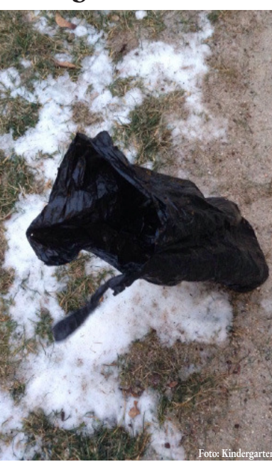
Überall im Hof verteilt: Volle Hundekotbeutel

Unglaublich, aber wahr: Unbekannte haben vor wenigen Tagen in der Nacht rund ein Dutzend Beutel, gefüllt mit Hundekot, in den Hof des städtischen Kindergartens Drachenburg geworfen. Als die städtischen Mitarbeiter am Morgen ihren Dienst antraten, trauten sie ihren Augen nicht. Die gefüllten schwarzen Säcke waren überall im Innenhof verteilt, in dem sich tagsüber eigentlich die Kinder mit den Spielgeräten vergnügen dürfen. Die schwarzen Tüten wurden im Kindergartenhof eingesammelt und entsorgt. Die Stadtverwaltung Bretten weist allerdings darauf hin, dass solche Aktionen auf keinen Fall Kavaliärsdelikte sind. Wer bei so etwas erwischt wird, für den wird es teuer. Dann muss man mit einem Bußgeld von bis zu 5000 Euro rechnen. mk