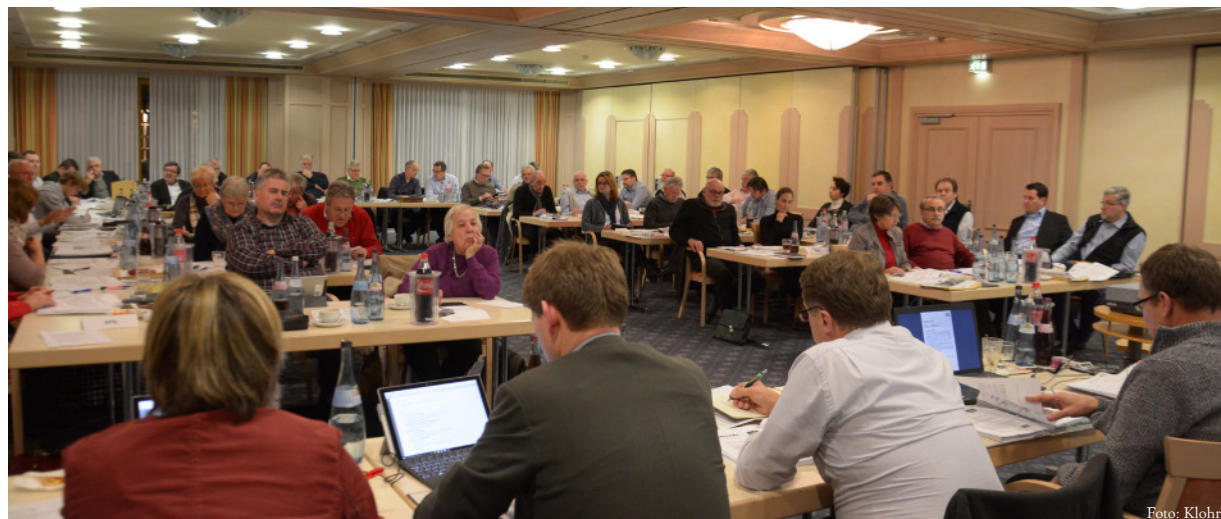
Kontrovers, aber konstruktiv: bei der Haushaltsklausurtagung des Gemeinderats geht es inhaltlich ans Eingemachte.

In Bretten geht was! Ausbau der Schulsozialarbeit, verbessertes Innenstadtmarketing, E-Mobilitäts-Offensive - das waren nur drei der größeren Themen, die der Brettener Gemeinderat bei seiner Haushaltsklausur am vergangenen Wochenende vorberaten und für gut befunden hat. Wo kann, wo will die Stadt in diesem und den nächsten Jahren investieren? Wo muss gespart werden? Die Klausursitzung am vergangenen Wochenende war von einem konstruktiven, mitunter auch kontroversen Ringen um Projekte und Budgets geprägt. Dabei wurden die großen