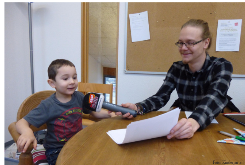
Spracherziehung einmal anders - Kinderstimmen im Radio.

Was passiert, wenn Kindersprache auf die Ästhetik von Rock'n'Roll-Plattencovern trifft? Antworten darauf gab es kürzlich im städtischen Kindergarten Drachenburg. Dort war ein Mitarbeiter des Karlsruher Radiosenders Die Neue Welle zu Gast, der den Kindern Plattencover zeigte - diese wiederum assoziierten frei und beschrieben, was sie mit ihrem ungestellten Blick sahen. Die Ergebnisse will der Sender für eine Marketingaktion nutzen.