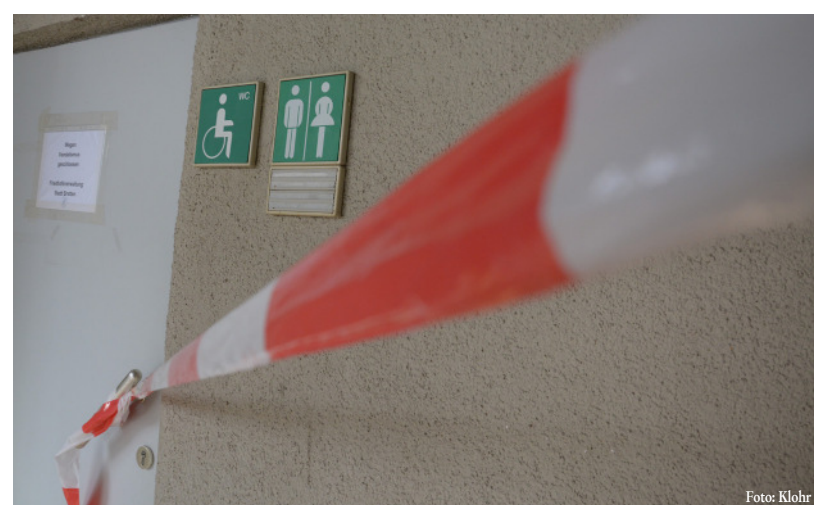
Benutzen Verboten: Brettener Friedhofstoiletten wegen Vandalismus geschlossen.

Feuer in der Kloschüssel, kaputte Klobrille, zerstörter Papierspender: Unbekannte haben in den vergangenen Wochen übel in der öffentlichen Toilette neben der Aussegnungshalle am Friedhof Bretten gewütet. Jetzt hat die Stadtverwaltung die Toilette bis auf Weiteres geschlossen. Eigentlich ist die Toilette tagsüber per Zeitschaltuhr für alle Friedhofsbesucher geöffnet.