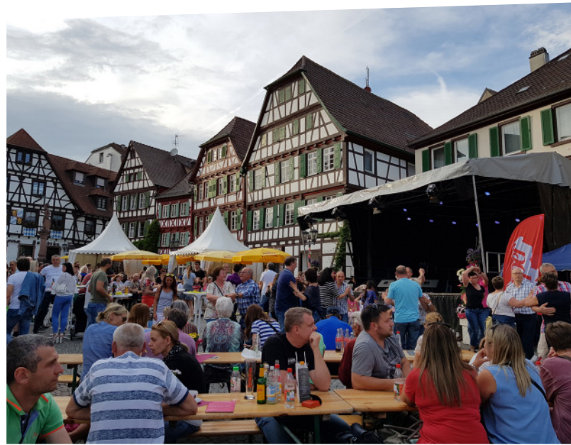
Feststimmung beim Brettener Frühling 2018