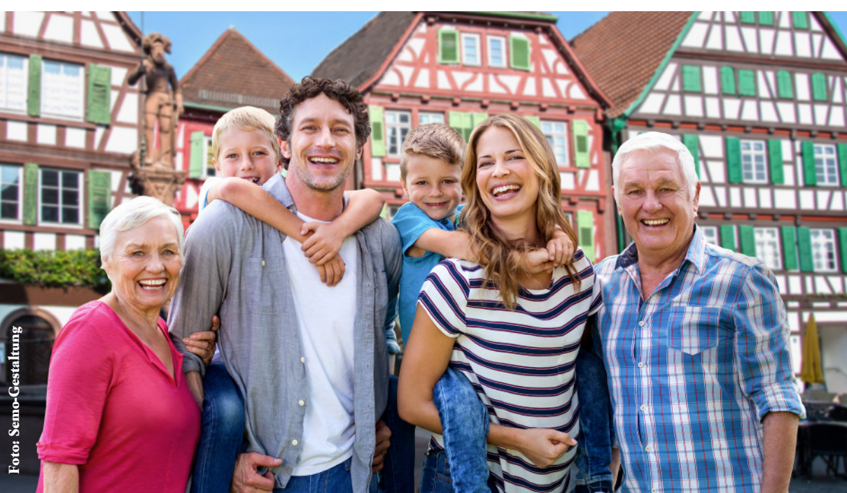
Die „Schokoladenseite“ von Bretten zeigen: Am Donnerstag, 26. März, 19 Uhr sind Gewerbetreibende, Gastronomen und Tourismusunternehmen eingeladen, sich in einer Info-Veranstaltung im Rahmen des Projekts „Kleinstadtperlen“ zur informieren.

Um vom boomenden Städtetourismus künftig stärker profitieren zu können, wurde von der Tourismus Marketing GmbH Baden-Württemberg (TMBW) 2018 das Projekt „Kleinstadtperlen“ ins Leben gerufen. Zwölf Kleinstädte in Baden-Württemberg wurden ausgewählt an diesem Projekt teilzunehmen. Bretten überzeugte mit seinen pittoresken Fachwerkhäusern, malerischen Altstadtgassen, dem individuellem Einzelhandel und der vielfältigen Gastronomie und gehört seit dem Projektstart der Initiative an. Gemeinsam mit der TMBW und den Industrie- und Handelskammern (IHK) im Land werben die Kleinstadt-