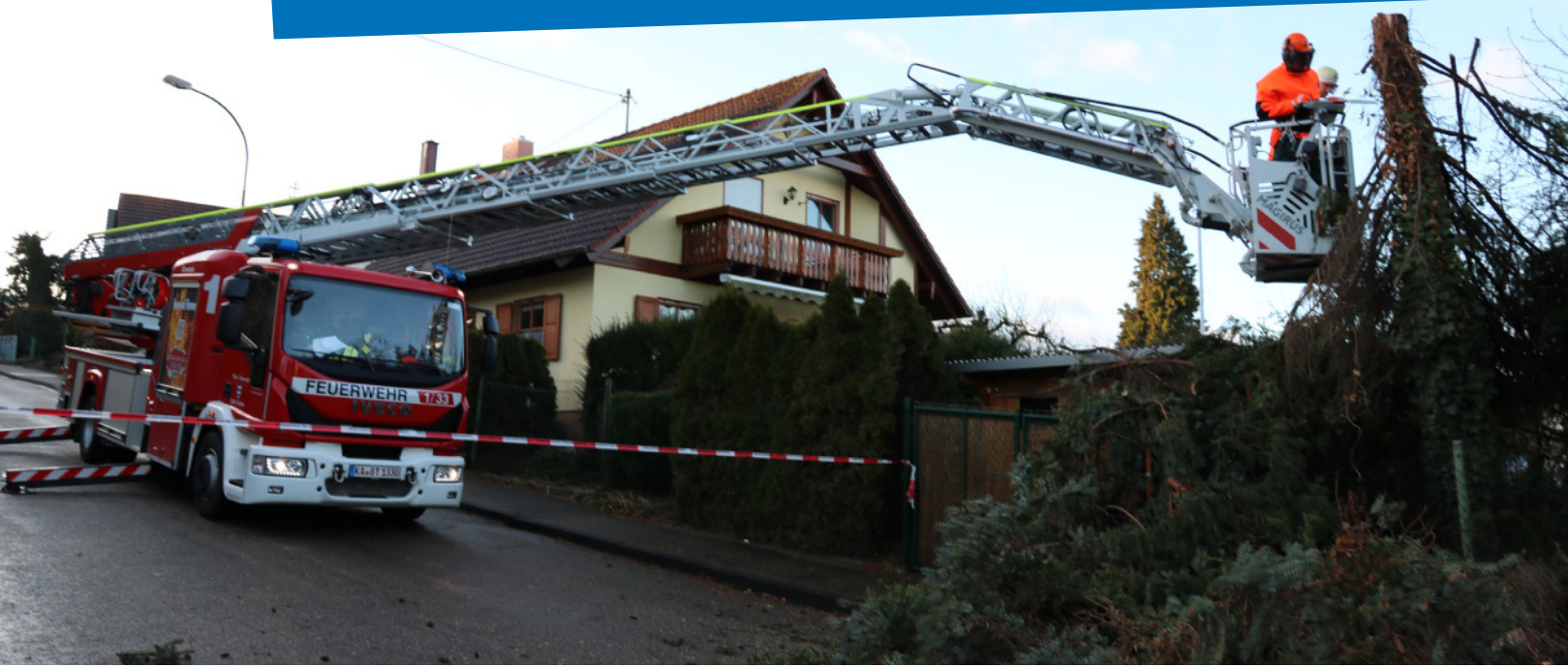
Rund 200 Mitarbeiter und Ehrenamtliche der Feuerwehr waren seit Sonntag, 20.30 Uhr, im Einsatz und räumten die zahlreichen umgestürzten Bäume und versperrten Straßen.