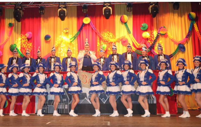
Auch in diesem Jahr präsentiert die Stadtkapelle/Musikverein das Beste aus der Brettener Bütt

Die Stadtkapelle / Musikverein präsentiert das Beste aus der Brettener Bütt. Für das leibliche Wohl ist wie jedes Jahr gesorgt. Karten erhalten Sie im Vorverkauf ab sofort bei der Tourist-Info Bretten, im Bürgerservice und in den Ortsverwaltungen für 8,00 €.