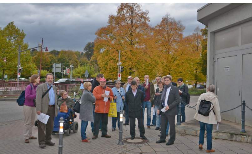
Die Teilnehmer des Fußverkehrs-Check bei einer der Begehungen in Bretten

Am 18. November fand im Großen Rathaussaal der Abschlussworkshop zum Fußverkehrs-Check