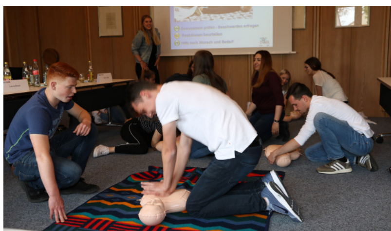
Das Gelernte gleich anzuwenden, übten die Auszubildenden bei der Herz-Druck-Massage

die Anwesenden ausprobieren, wie man eine bewußtlose Person mit Hilfe des Rettungsgriiffs aus einem Auto befreit und wie eine Wiederbelebung korrekt durchgeführt wird. Das erlernte Wissen wird den Jugendlichen nicht nur privat weiterhelfen. Sie können nun auch als Ersthelfer im Rathaus und den verschiedenen Außenstellen in Notsituationen helfen.