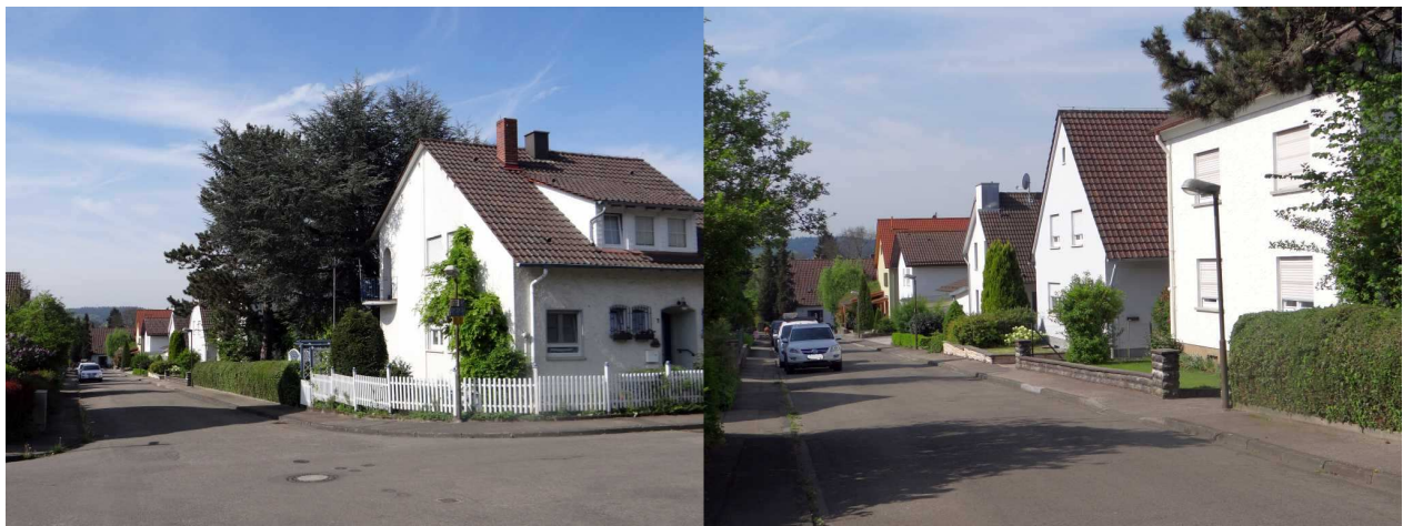
Abb. 8: verschiedene Habitatstrukturen

Im Rahmen des Bebauungsplans kann durch entsprechende Festsetzungen eine Wiederbegrünung neu bebauter Grundstücke geregelt werden, so dass in gewissem Umfang für die Schaffung von Ersatzpflanzungen für gerodete Gehölze Sorge getragen werden kann.