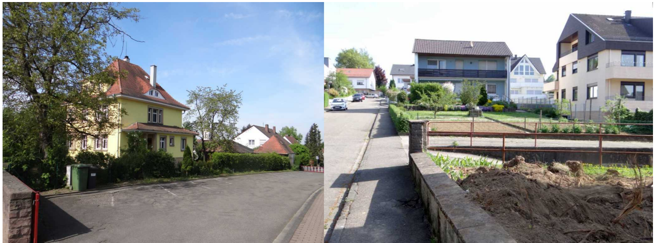
Abb. 7: verschiedene Habitatstrukturen

Ein Vorkommen seltener Arten kann auch aufgrund der fast vollständigen Isolation des Gebietes von der offenen Landschaft relativ sicher ausgeschlossen werden.