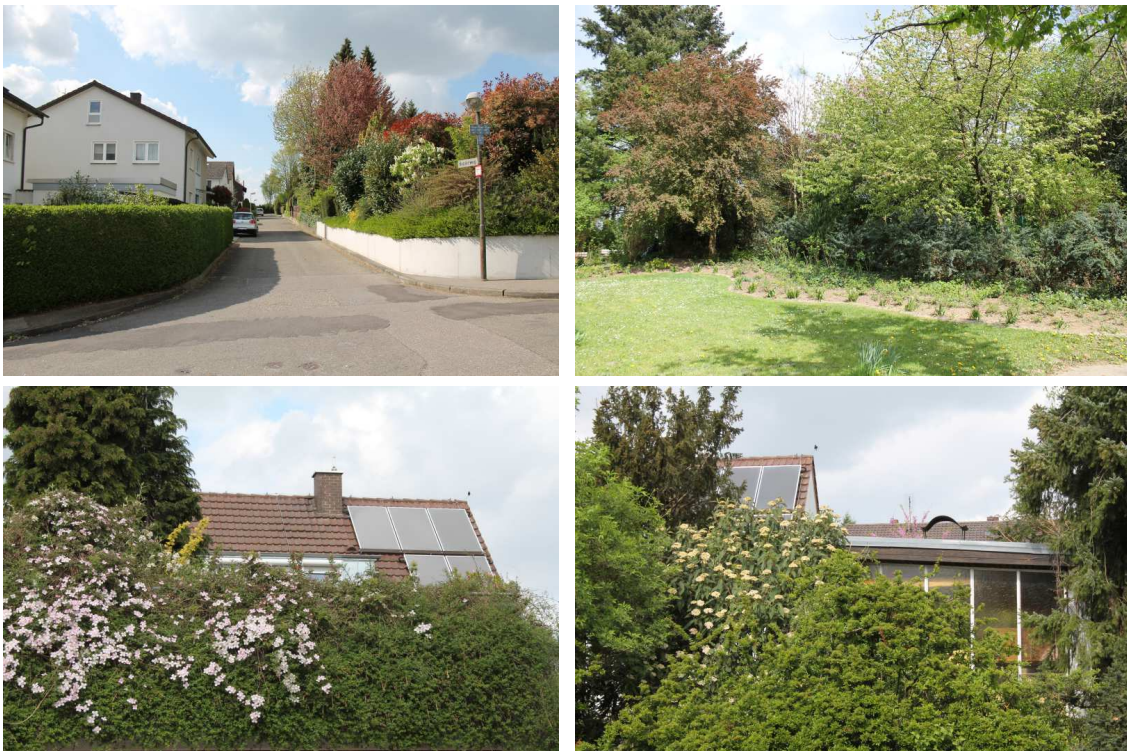
Abb. 6: verschiedene Gehölzstrukturen im Plangebiet

In den Gehölzbeständen zwischen den Gebäuden bzw. in den Gärten waren – soweit zugänglich und einsehbar – keine geeigneten Unterschlupfmöglichkeiten erkennbar.