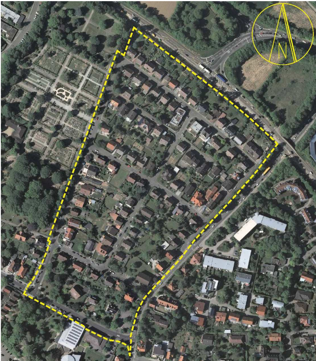
Abb. 1: Abgrenzung B-Plan „Am Schänzle“

Die Stadt Bretten plant die Aufstellung des Bebauungsplans „Am Schänzle“ für die aus städtebaulicher Sicht sinnvolle und erforderliche Steuerung der Weiterentwicklung dieses Wohngebietes, da die im bislang rechtsgültigen Bebauungsplan „Hinter dem Kloster und Im Breitenbaum“ getroffenen Aussagen nicht genau bzw. nicht umfassend genug sind.