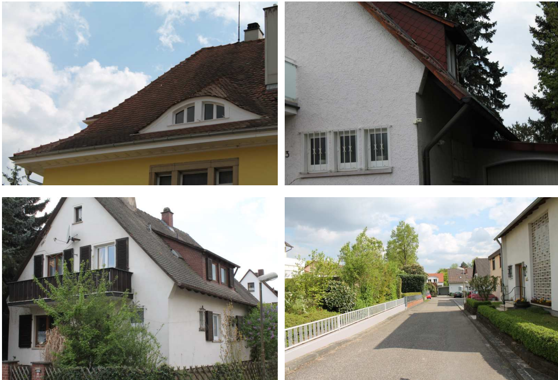
Abb. 4: verschiedene Fassadentypen

Die meisten Fassaden sind verputzt, Spaltenquartiere hinter Holz- und anderen Fassadenverkleidungen gibt es nicht oder die wenigen Verkleidungen die vorhanden sind, weisen soweit sichtbar keine entsprechenden Spalten auf. Mögliche Quartiere in Rollladenkästen können nicht ausgeschlossen werden. Ebenso haben einige Gebäude Dachüberstände, die wenn entsprechende Fugen oder Spalten vorhanden sind, als Quartier von Fledermäusen bezogen werden können. Allerdings konnten nur bei wenigen Gebäuden solche Spalten an den Überständen entdeckt werden. Fensterläden aus Holz hat nur ein Gebäude und diese sind Fensterläden mit Lamellen die für Fledermäuse aufgrund der Zugluft wenig attraktiv sind.