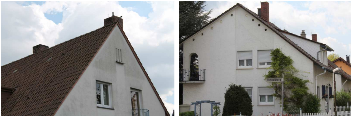
Abb. 5: potentielle Einflugöffnungen in Dachböden