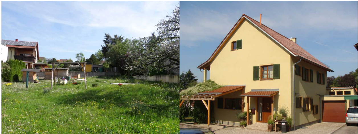
Baulücke - Neubebauung

Die Gärten im Plangebiet sind unterschiedlich strukturiert jedoch zum aller größten Teil im landläufigen Sinne „gepflegt“.