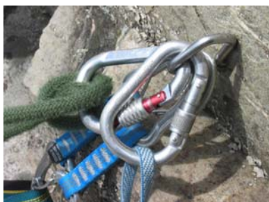
Sicherheit hat immer Vorrang!

Alle Kurse finden am Battertfelsen bei Baden-Baden statt. Treffpunkt Ebersteinburg bei Baden-Baden am Haupteingang des Hotel Wolfsschlucht (Eigene Anreise).