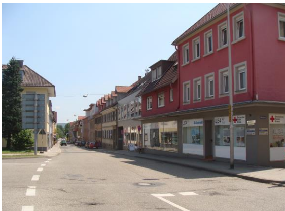
Nr. 1: Weißhofer Straße 54 - 64 geschlossene Bauweise