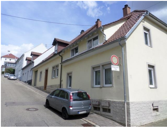
Nr. 11: Hildastraße 11-3 geschlossene Bauweise