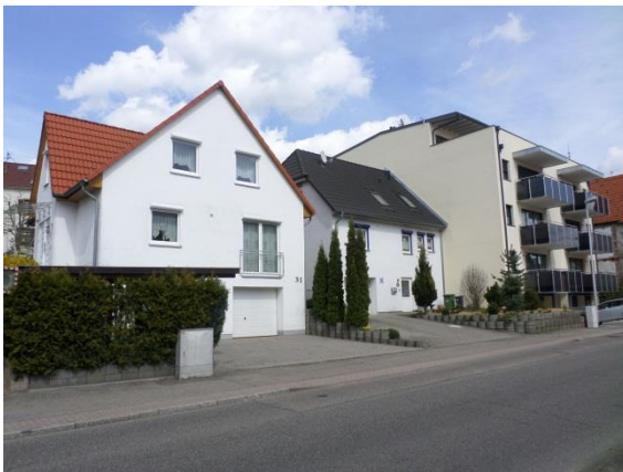
Nr. 9: Georg-Wörner-Straße 31, 33 und 35 abweichende Bauweise