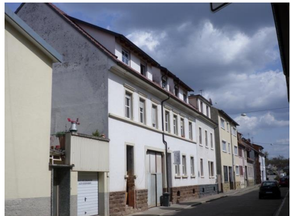
Nr. 6: Friedrichstraße 43-45 abweichende Bauweise