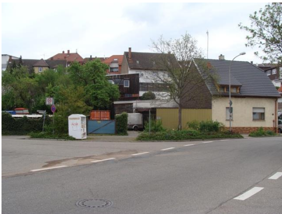
Nr. 5: städtische Grünflächen und Versorgungseinrichtung (Altkleidercontainer)