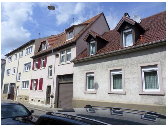
Nr. 7: Friedrichstraße 51-51 abweichende Bauweise